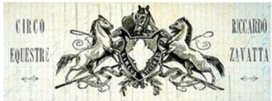
il Circo equestre "Zavatta"

Sul finire del secolo scorso i festeggiamenti vennero protratti dai pochi giorni seguenti la festività di San Michele, sino alla fine di ottobre per unire idealmente le due festività più care ai mestrini, quella del patrono (29 settembre) con quella dell' anniversario della Sortita (27 ottobre), la battaglia risorgimentale che aveva dato a Mestre un momento di gloria nazionale.