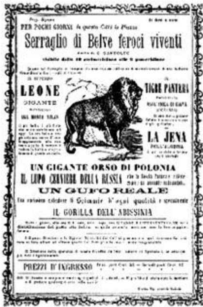
locandina che reclamizza spettacoli con animali

Un proclama del Podestà di Mestre, Andrea Contarini, rendeva nota, il 9 marzo 1689, la concessione da parte del Senato della Repubblica di "un mercato di cavalli franco et esente, ogni secondo venerdì di cadaun mese et in oltre di quattro giorni continuati all'anno principiando da quello di San Michele, 29 settembre".