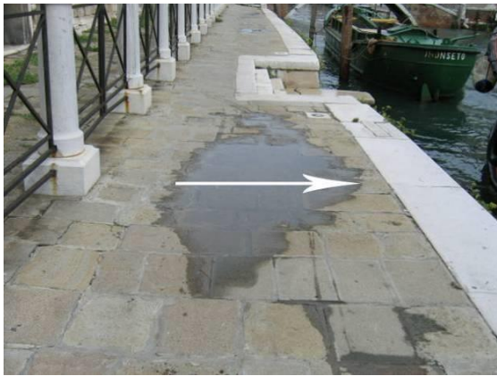
Esempio ulteriore di avvallamento di dimensioni contenute ma costituente un grave ostacolo ai pedoni.