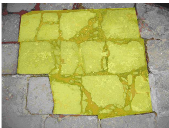
Dissesto in area ben delimitata