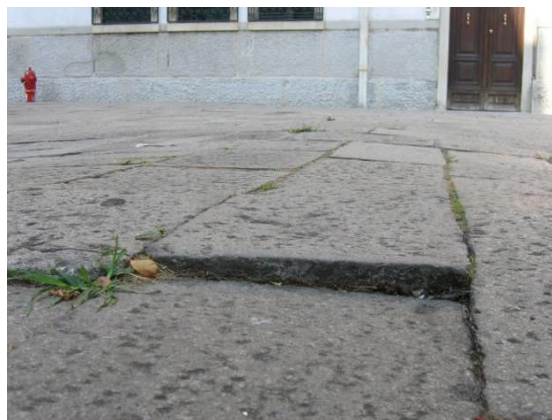
Cedimento di un singolo elemento rispetto piano della calle