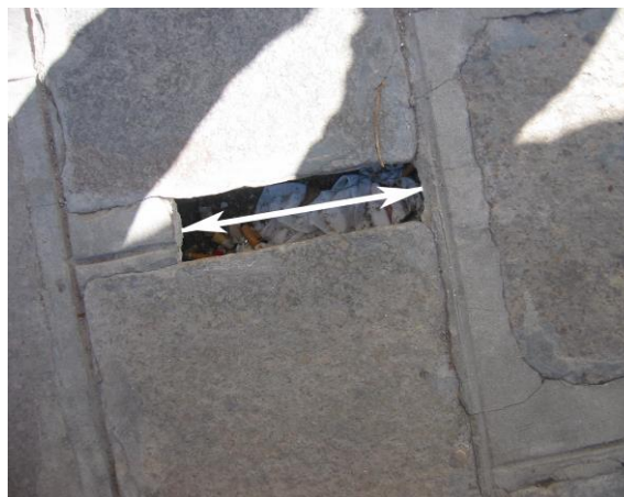
Mancanza totale della fuga con presenza di foro

h) ARREDO URBANO : sono presenti diverse tipologie di elementi: