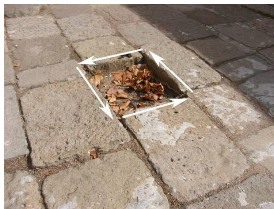
Esempio di mancanza totale di uno o più elementi