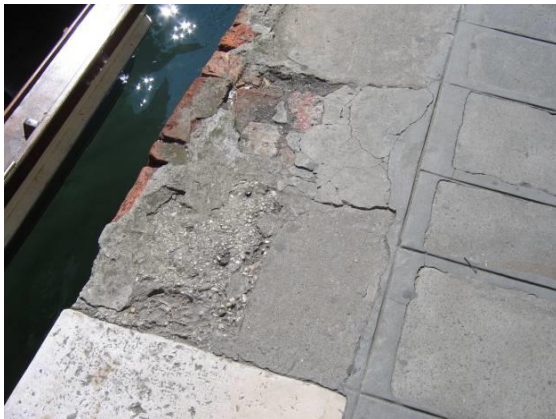
Mancanza con assenza parziale di elementi

d) MANCANZE : si riscontrano nel caso in cui manchino interi elementi o anche soltanto parti di