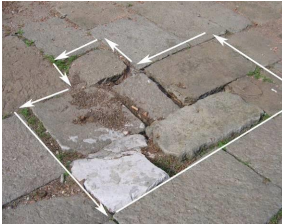
Dissesto con presenza di discontinuità (scalini), un caso estremo