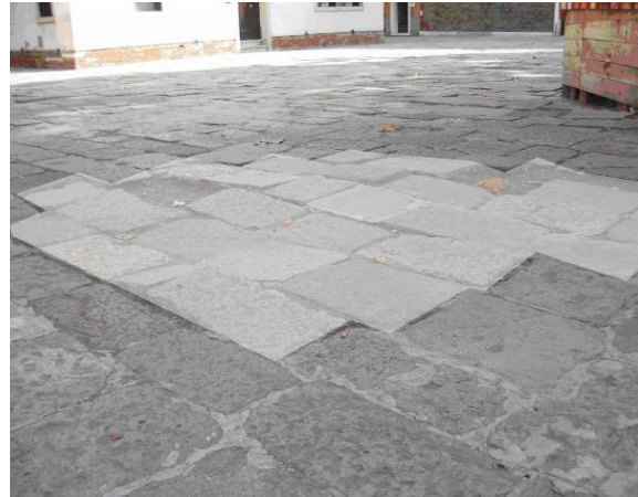
Caso difficilmente circoscrivibile: stima della superficie complessiva..

d) MANCANZE : si riscontrano nel caso in cui manchino interi elementi o anche soltanto parti di