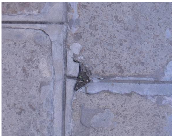
Pavimentazione a giunto fugato