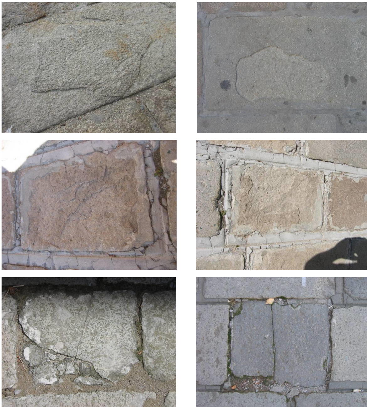
Esempi di diversi tipi di usura della pavimentazione