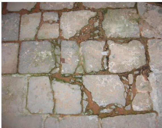
Mancanza di fughe estesa