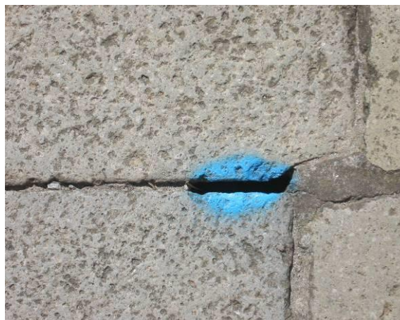
Pavimentazione a giunto unito