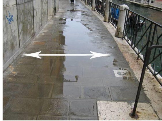
Esempi di ostruzione al 100%; entrambi gli avvallamenti hanno larghezza maggiore di 1,2 m.