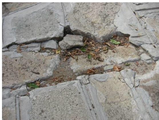
Esempio di danneggiamento di uno o più elementi