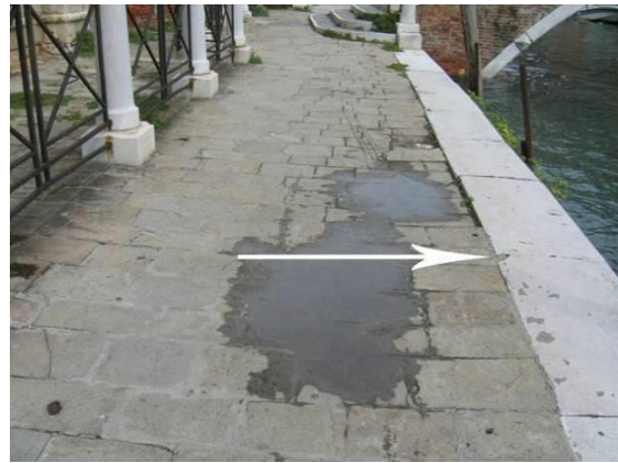
Esempio di come in caso di depressione multiforme si debba considerare, in fase di rilevamento, la larghezza massima ostruita.