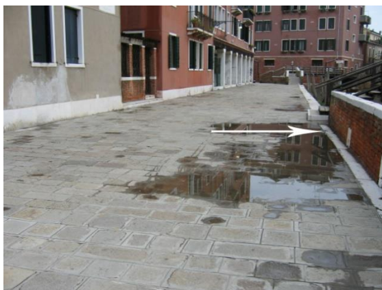
Avvallamento dalla larghezza > 1,2 m ma grado di ostruzione relativamente basso (25 -50 %).