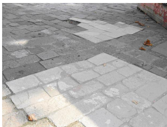
Dissesto in aree distinte