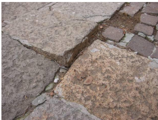
Rialzo di un singolo elemento rispetto piano della calle

Le immagini rappresentano le diverse posizioni in cui si può trovare uno scalino