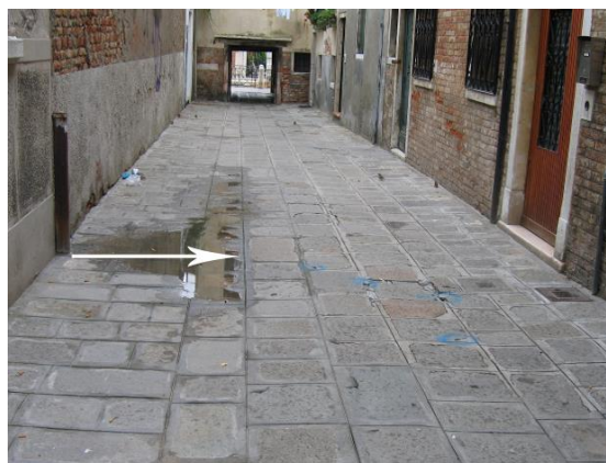
Avvallamento ridotto ( L < 1,2 m) dal grado di ostruzione basso (0 - 25%)