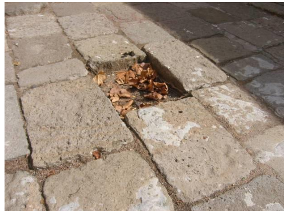
Mancanza totale di elemento

e) USURA (EROSIONE/ESFOLIAZIONE/FESSURE/CREPE SUPERFICIE) L'erosione, l'essfoliazione, la fessurazione e le crepe degli elementi, sono uno dei degradi più diffusi tra quelli che riguardano la pavimentazione del centro storico di Venezia.