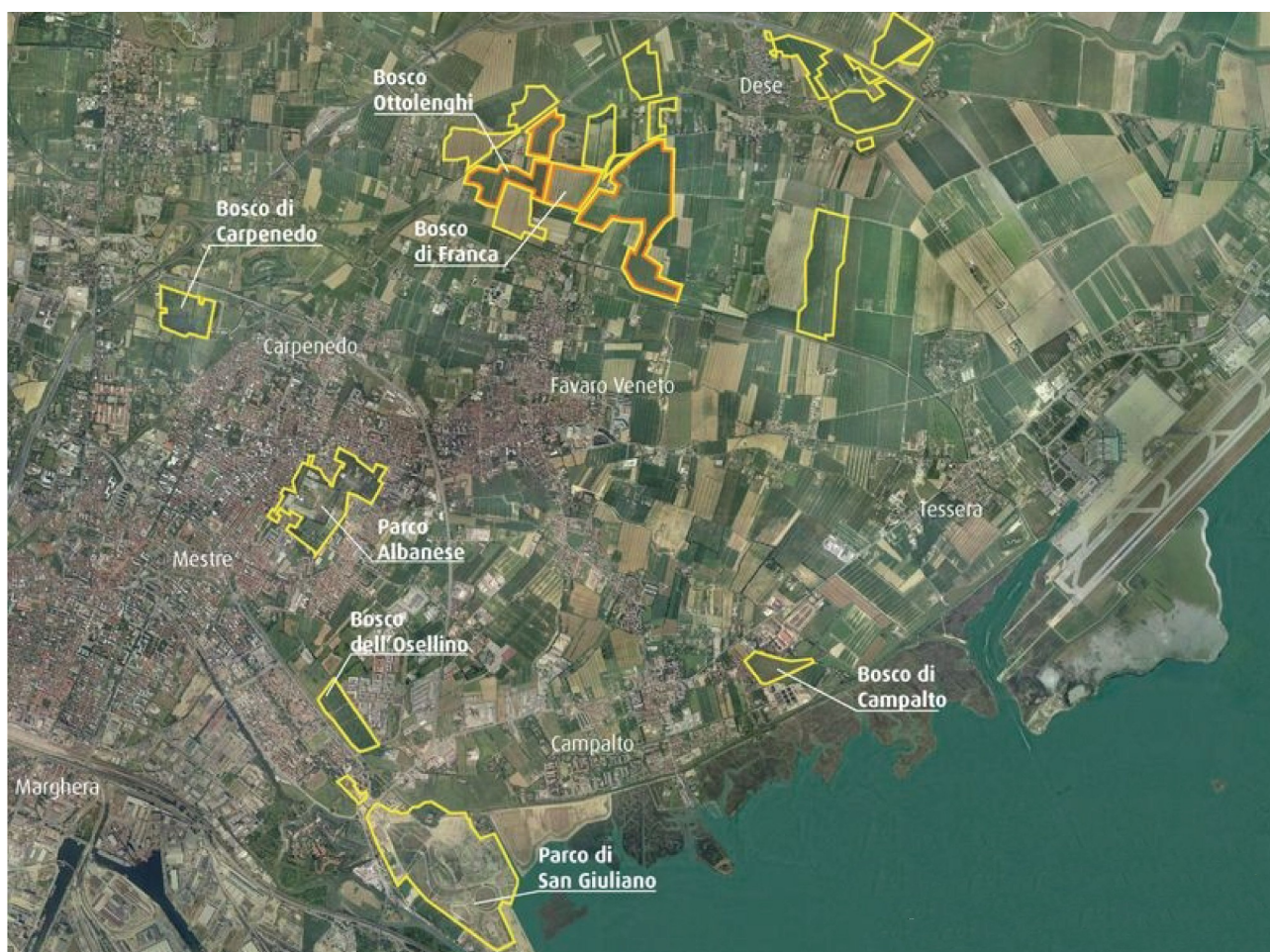
Fig. 1 - Ortofotopiano di inquadramento

Nel V.P.R.G. del Comune di Venezia per la Terraferma il Parco Albanese è classificato come z.t.o. F -Verde Attrezzato (art. 56 delle Norme Tecniche Speciali d'Attuazione) mentre il Parco San Giuliano è classificato come z.t.o. F -Verde Urbano Attrezzato (art. 47 delle medesime Norme Tecniche), oggi aperto al pubblico per ha 28.