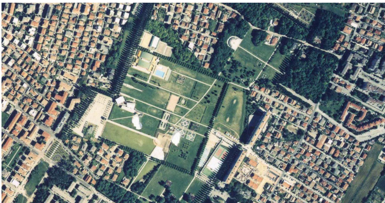
Fig. 2 - Ortofotopiano del Parco A. Albanese alla Bissuola.

Gli interventi previsti nel presente appalto , per entrambi i parchi, interesseranno le zone a prato, a prato alberato e aree boscate. Le lavorazioni saranno mirate al mantenimento del patrimonio esistente.