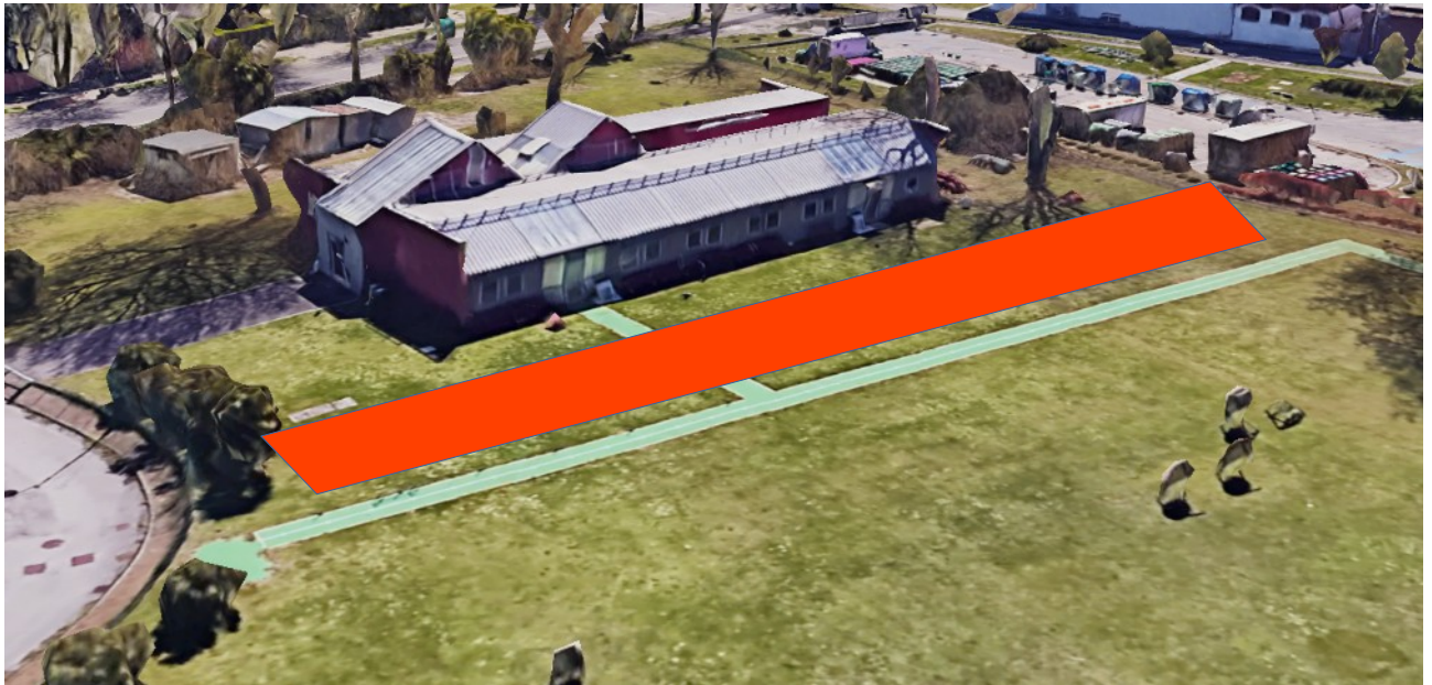
Area ipotizzata per nuovo manufatto ombreggiante

Il Direttore Lavori Pubblici - Ing. Simone Agrondi Settore Edilizia Comunale Venezia Centro Storico ed Isole - Dirigente arch. Silvia Loreto silvia.loreto@comune.venezia.it - tel. 041.2748092 Servizio Edilizia 1 Venezia Centro Storico e Isole - ing. Giovanni Voltolina giovanni.voltolina@comune.venezia.it - tel 041 2748456 PEC: dirlavoripubblici@pec.comune.venezia.it Sede di Venezia, Ca' Farsetti - San Marco, 4136 Documento conforme al Sistema di Gestione per la Qualità ISO 9001:2008