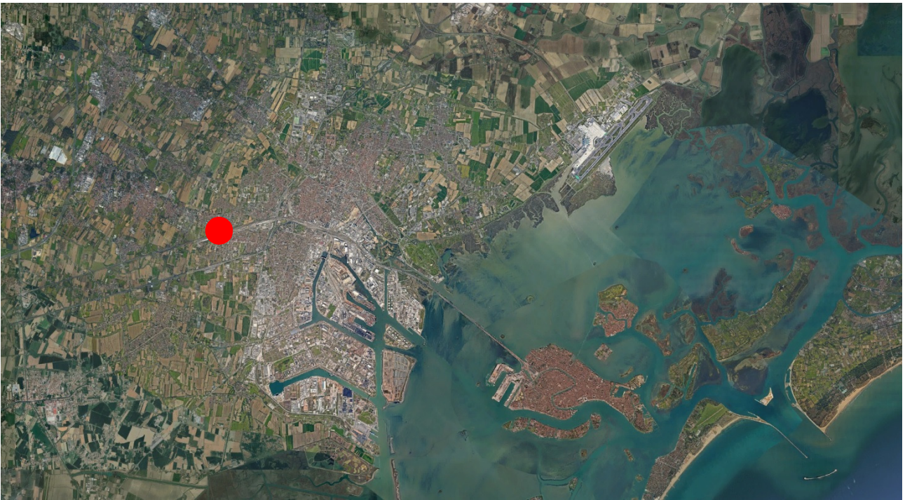
localizzazione dell'area di intervento rispetto a Venezia e a Mestre

L'intervento oggetto del presente DIP è stato denominato "C.I. 15464 – MANUTENZIONE STRAORDINARIA CAVALCAVIA VIA TRIESTE" e riguarda la manutenzione del manufatto che scavalca le linee ferroviarie Venezia – Milano e Venezia – Castelfranco Veneto e che collega Chirignano con Marghera.