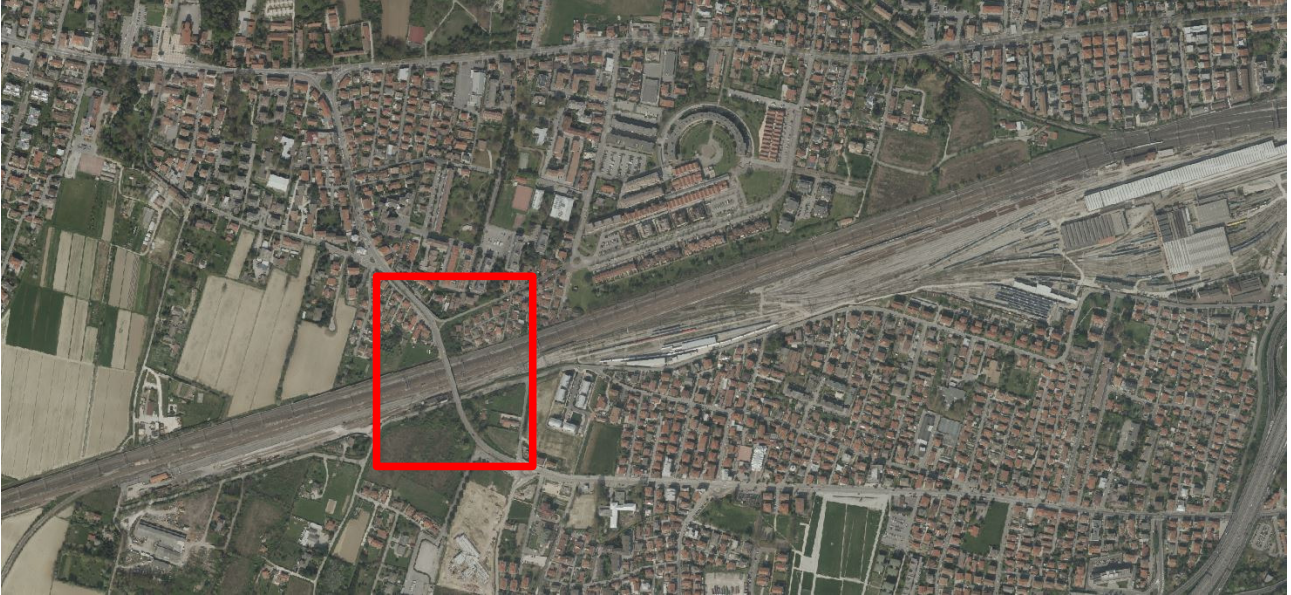
area di intervento