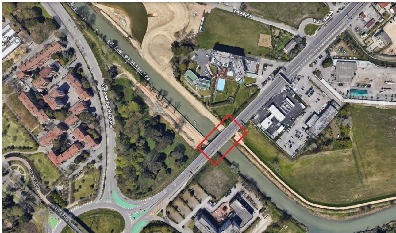
area di intervento