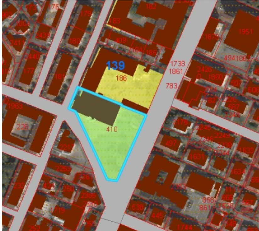
Mappale catasto terreni 410

Le aree di intervento sono sottoposte ai seguenti vincoli: