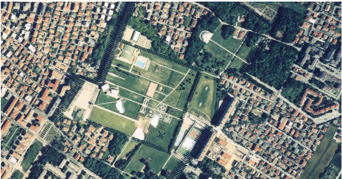
Fig. 2 - Ortofotopiano del Parco A. Albanese alla Bissuola.

Gli interventi previsti nel presente appalto , per entrambi i parchi, interesseranno le zone a prato, a prato alberato e aree boscate. Le lavorazioni saranno mirate al mantenimento del patrimonio esistente.