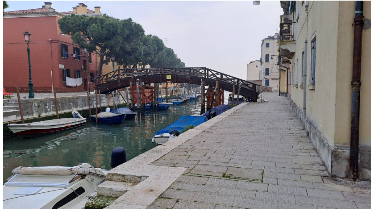
Il ponte visto da Sud

AREA LAVORI PUBBLICI, MOBILITÀ E TRASPORTI Settore Viabilità Venezia Centro Storico e Isole, Mobilità Acqua, Energia e Impianti Servizio Manutenzione 1 Venezia Centro Storico e Isole