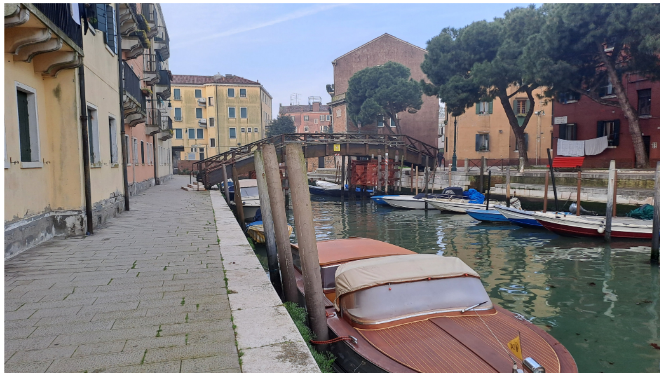
Il ponte visto da Nord