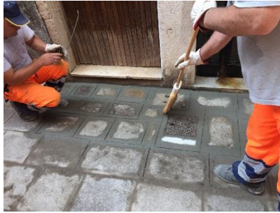
Foto2 – ripristino pavimentazione con pozzetto