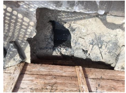
Foto 3 Realizzazione pozzetto d'ispezione

Alle ore 12.30 viene chiusa la prima visita di collaudo.