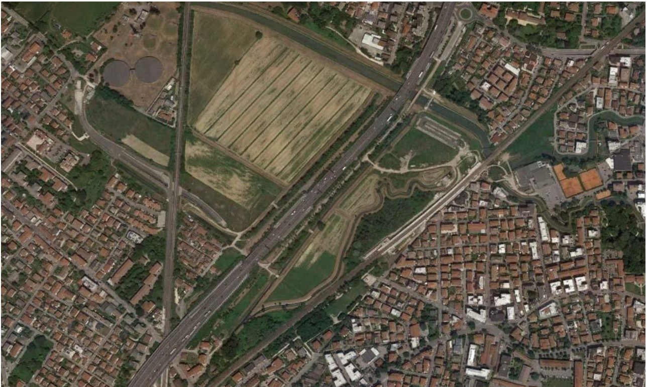
Figura 1 - Estratto ortofoto dello stato di fatto

Le aree su cui ricadono le opere in oggetto di variante si collocano in adiacenza al rilevato della Tangenziale Ovest di Mestre; in particolare, nel tratto di viabilità di servizio C.A.V. (ad oggi in gestione al comune di Venezia) posto tra via Gazzera Bassa, e l'attuale ponte di attraversamento sul canale Marzenego. In tale ambito l'intervento di progetto di riqualifica della viabilità stradale, prevede la realizzazione di un insieme di opere finalizzate sia al miglioramento della rete viaria urbana locale del rione di Gazzera sia alla realizzazione di raccordo viario collegante via Brendole con la nuova fermata ferroviaria di via Olimpia.