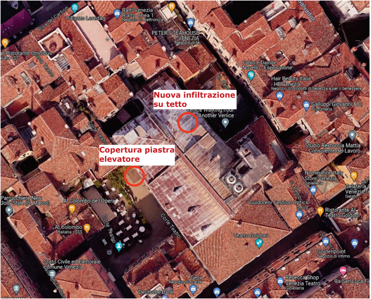
- TEATRO GOLDONI