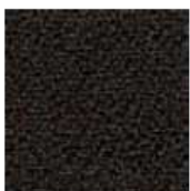
C10 Nero / Black