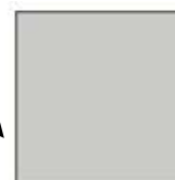
T62 Grigio cenere