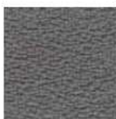
C09 Grigio / Gray