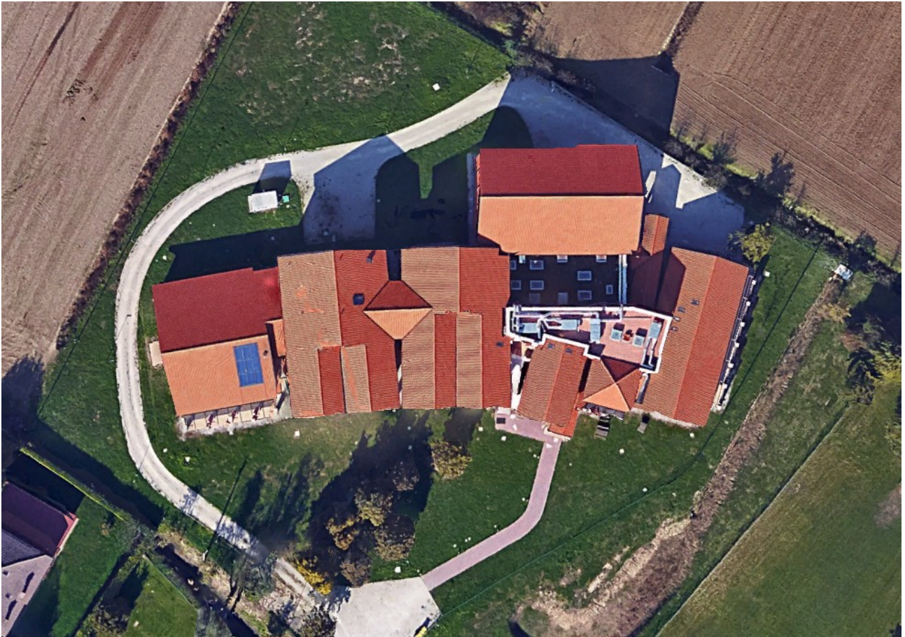
Figura 1: Scuola Primaria Statale Rita Levi Montalcini