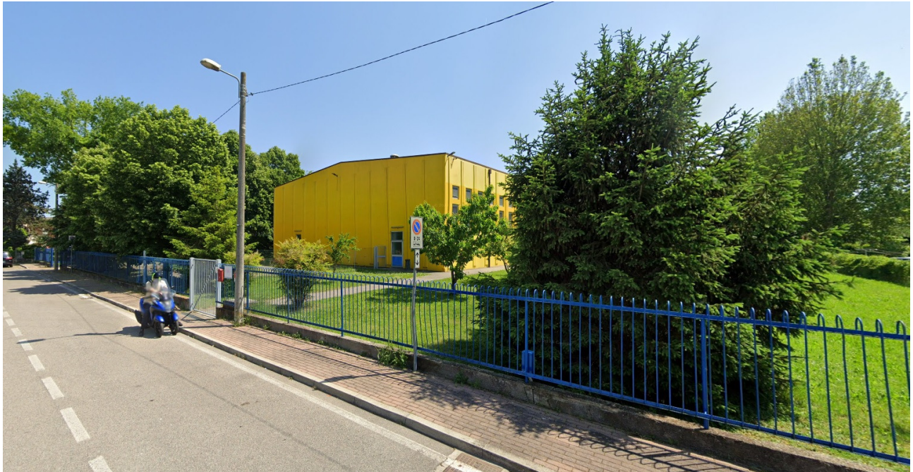
vista della Palestra da via Claudia

Area Lavori Pubblici, Mobilità e Trasporti Settore Edilizia Comunale Terraferma Servizio Edilizia 1 Terraferma