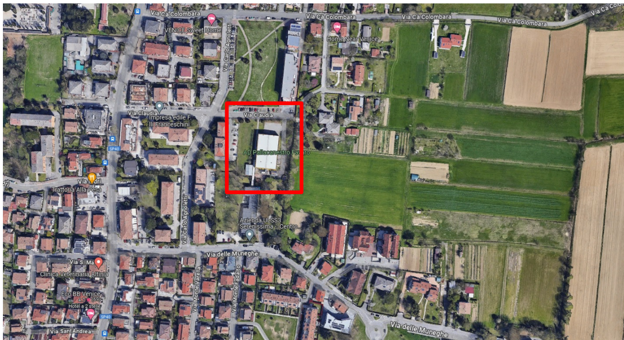
area di intervento e viabilità esistente