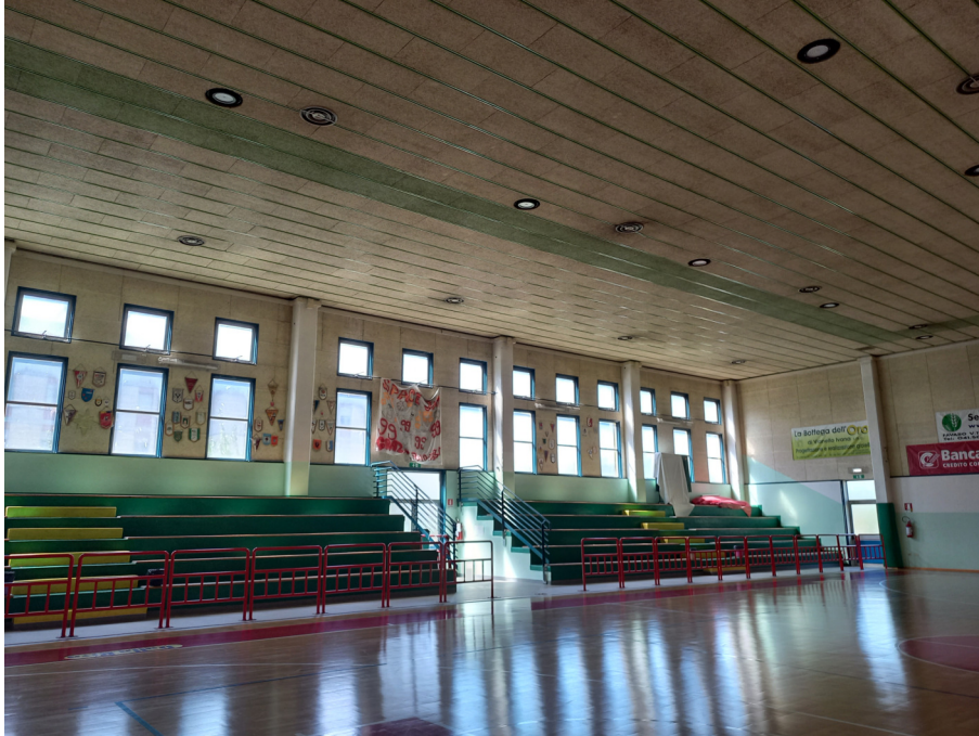
vista interna del prospetto ovest – scansione strutturale e gradinata