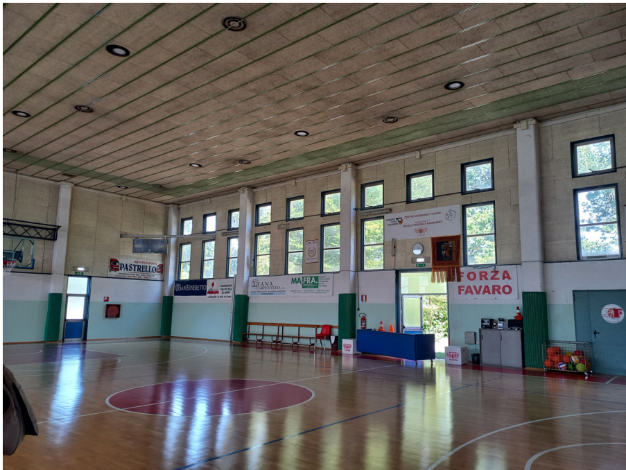
vista interna del prospetto est – scansione strutturale