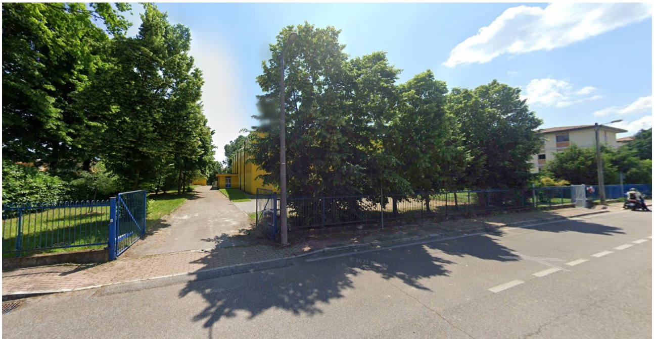
accesso carraio da via Claudia