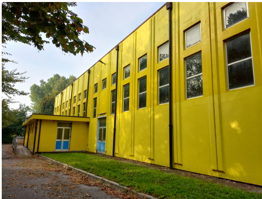
prospetto est in pannelli in c.a.v.

Le murature esterne della palestra sono state realizzate in pannelli in c.a.v. rivestite internamente con una controparete. Le pannellature sono agganciate alla struttura in pilastri e travi, sempre in c.a.v.