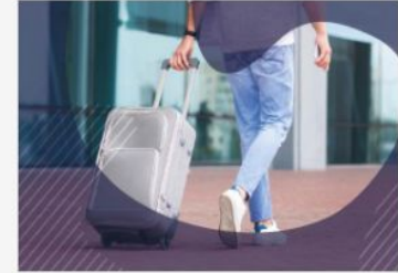
Vita e lavoro