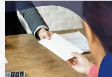
EURES Targeted Mobility Scheme