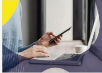
Trova un lavoro