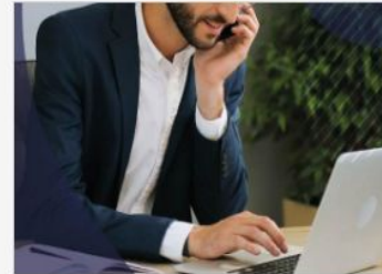
Ricerca di consulenti EURES