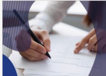
Crea / Modifica il tuo CV