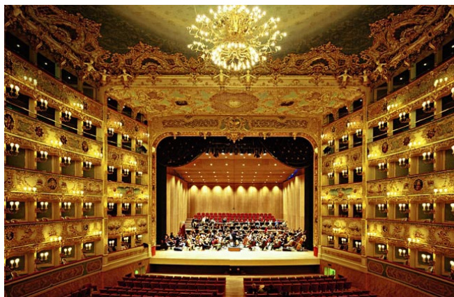
Teatro La Fenice Campo San Fantin, Venezia

Il concerto è aperto alle autorità, alla cittadinanza e alle associazioni di volontariato.