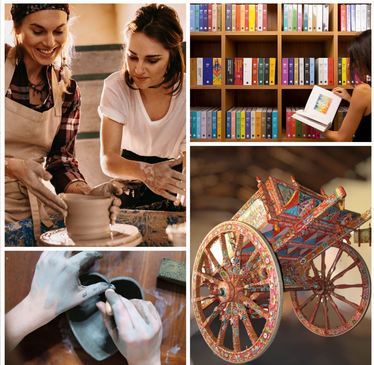
Alcune delle passeggiate patrimoniali organizzate nel Cilento, Treviso e Catania