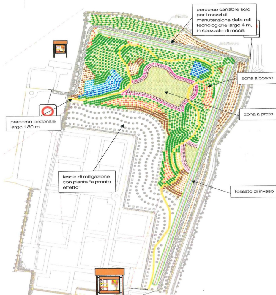
Figura 6 Planimetria sesto d'impianto bosco naturalistico.