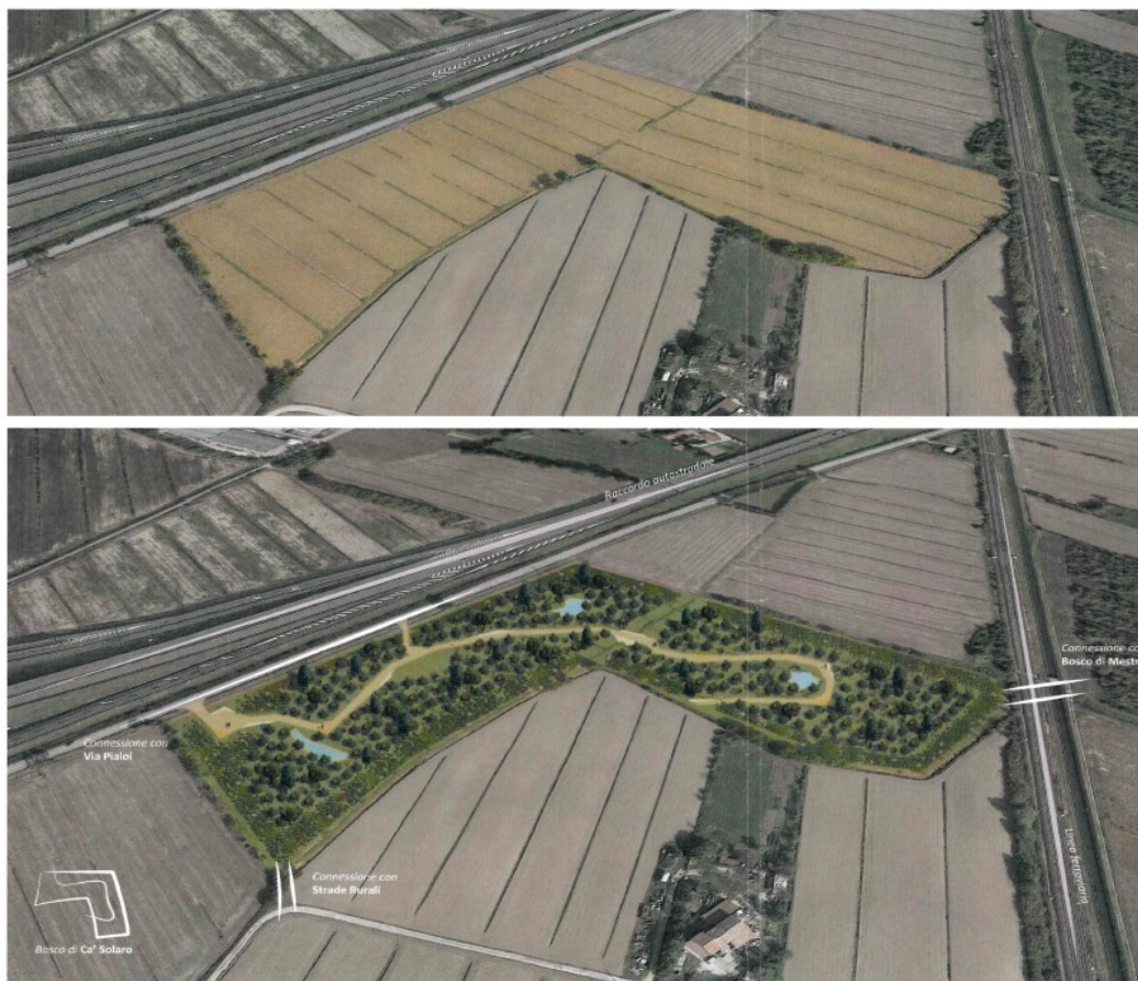
Figura 2 nuovo impianto Bosco di Dese