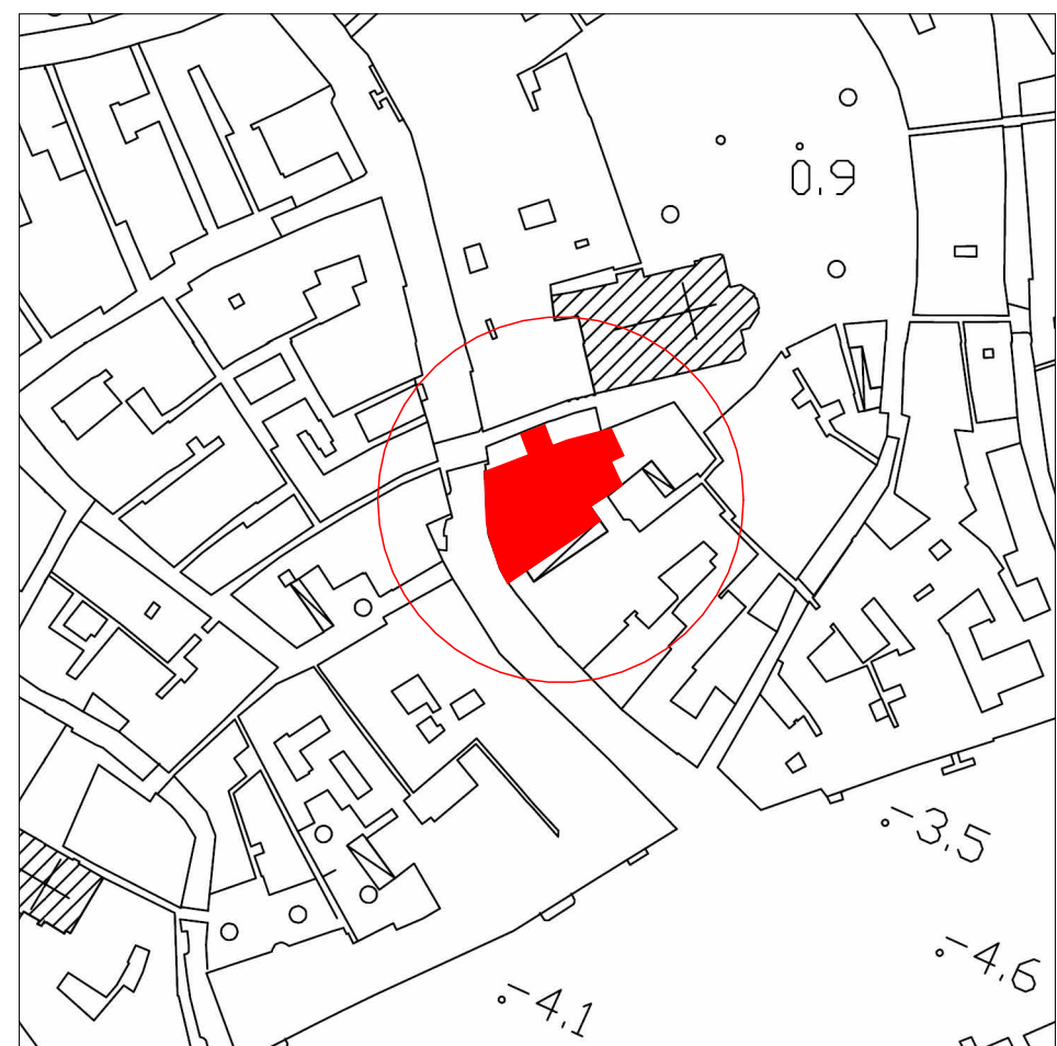
Estratto CTR con individuazione dell'ambito oggetto dell'intervento scala 1: 2000

Via Roma, 105 I-35028 Piove di Sacco Italia T. +39 049 5840414 F. +39 049 5714861 M. info@studionon.com P. carlo.tonon@ingpec.eu T. +39 348 3040864