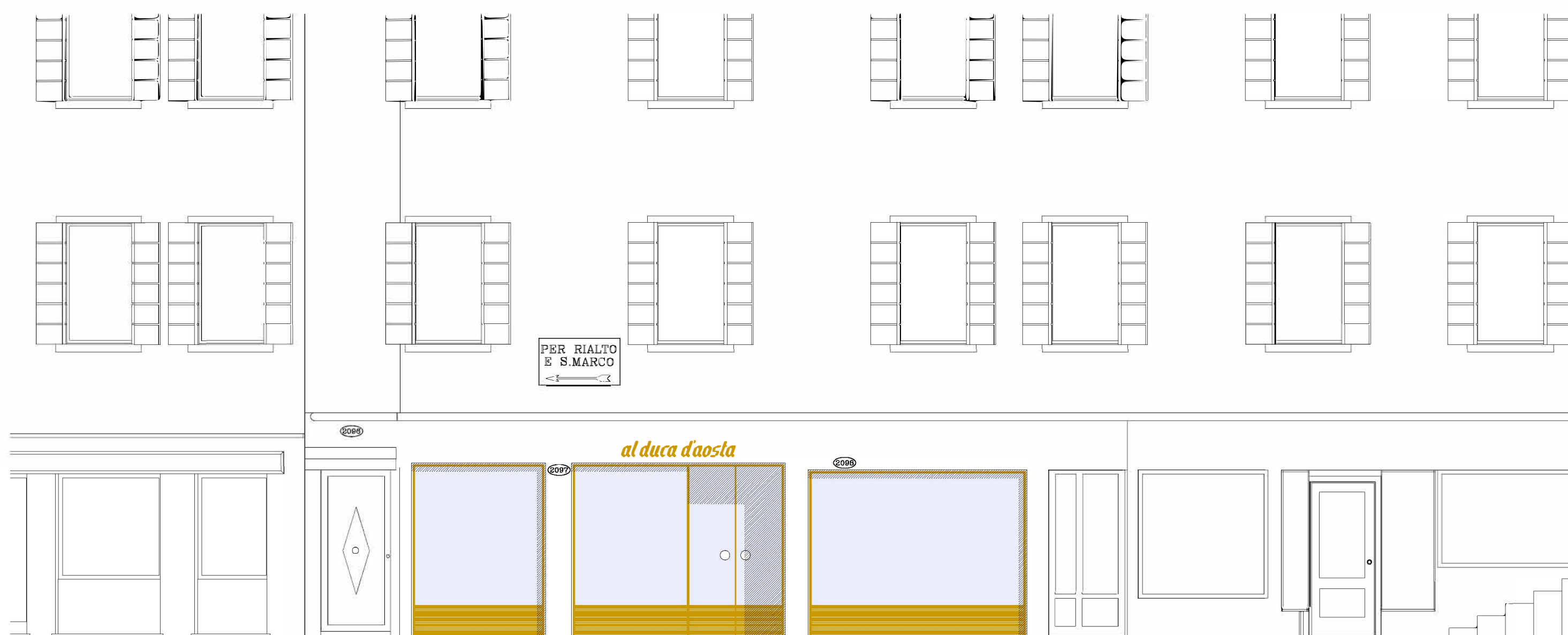
03- prospetto vetrine lato calle