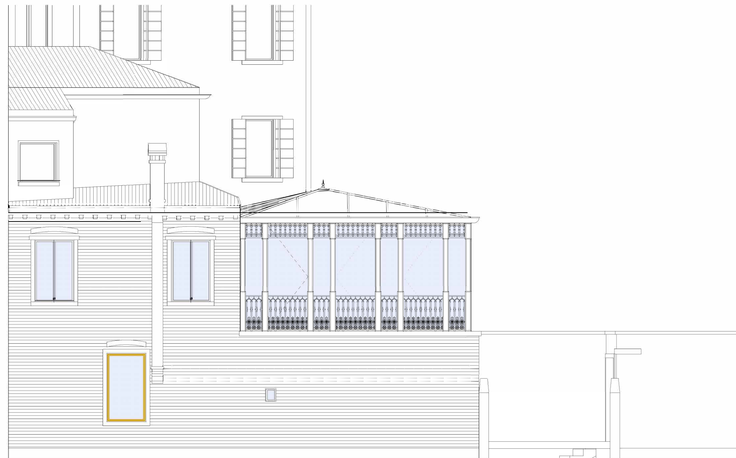
02- prospetto lato canale