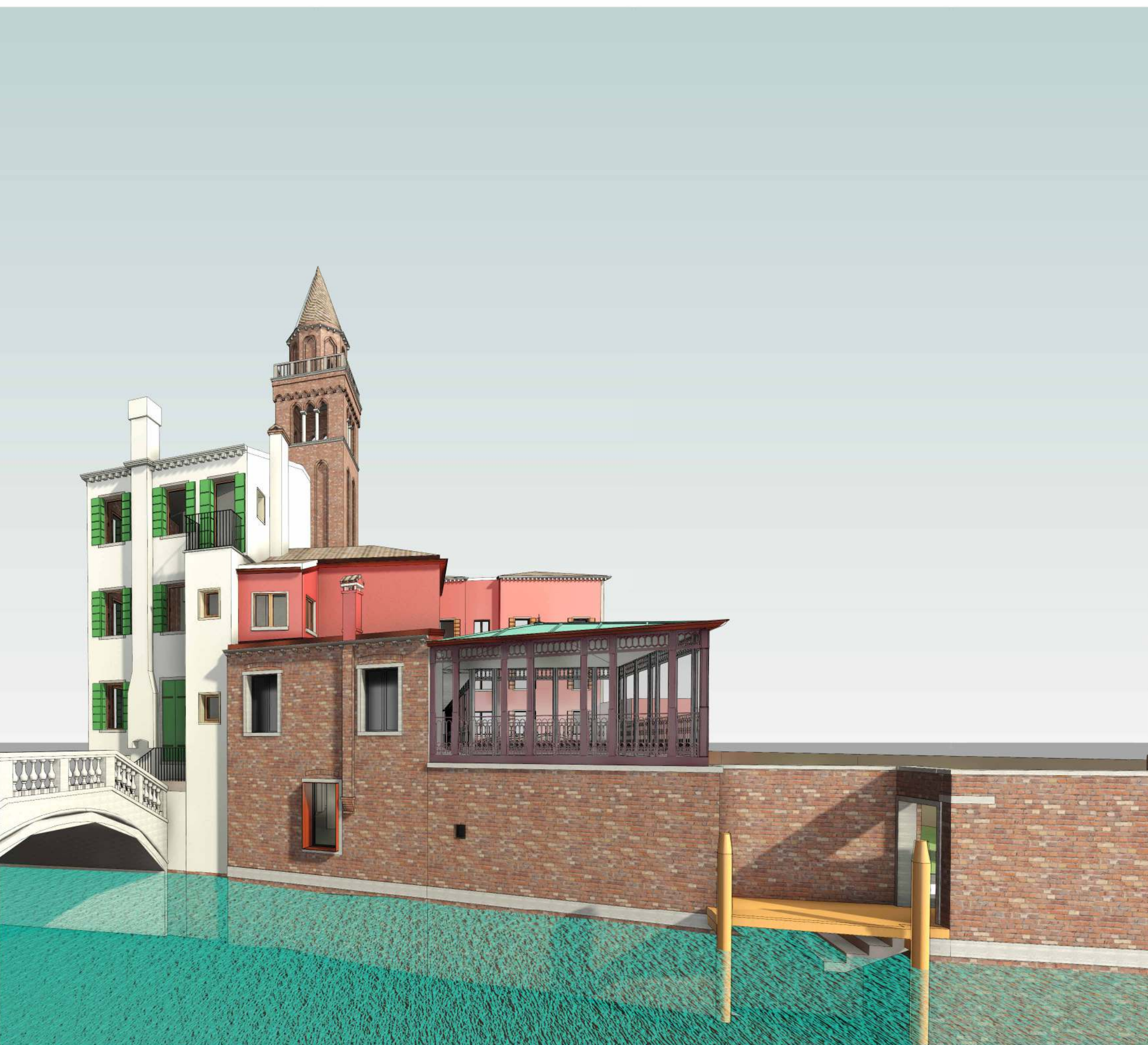
VISTA PROSPETTICA RIO DEI SAONERI Scala | STATO DI PROGETTO