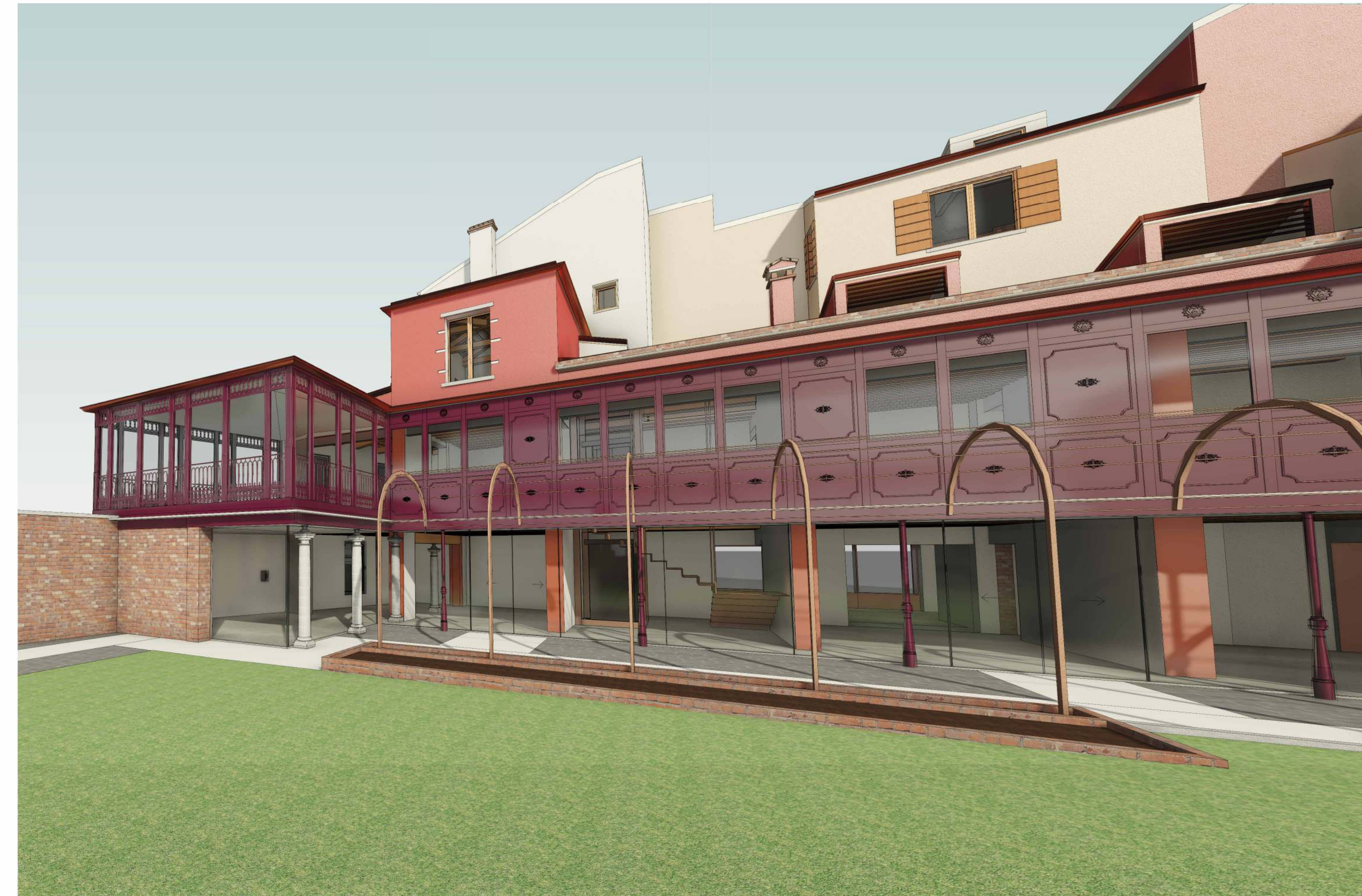
VISTA PROSPETTICA GIARDINO SUD OVEST Scala | STATO DI PROGETTO