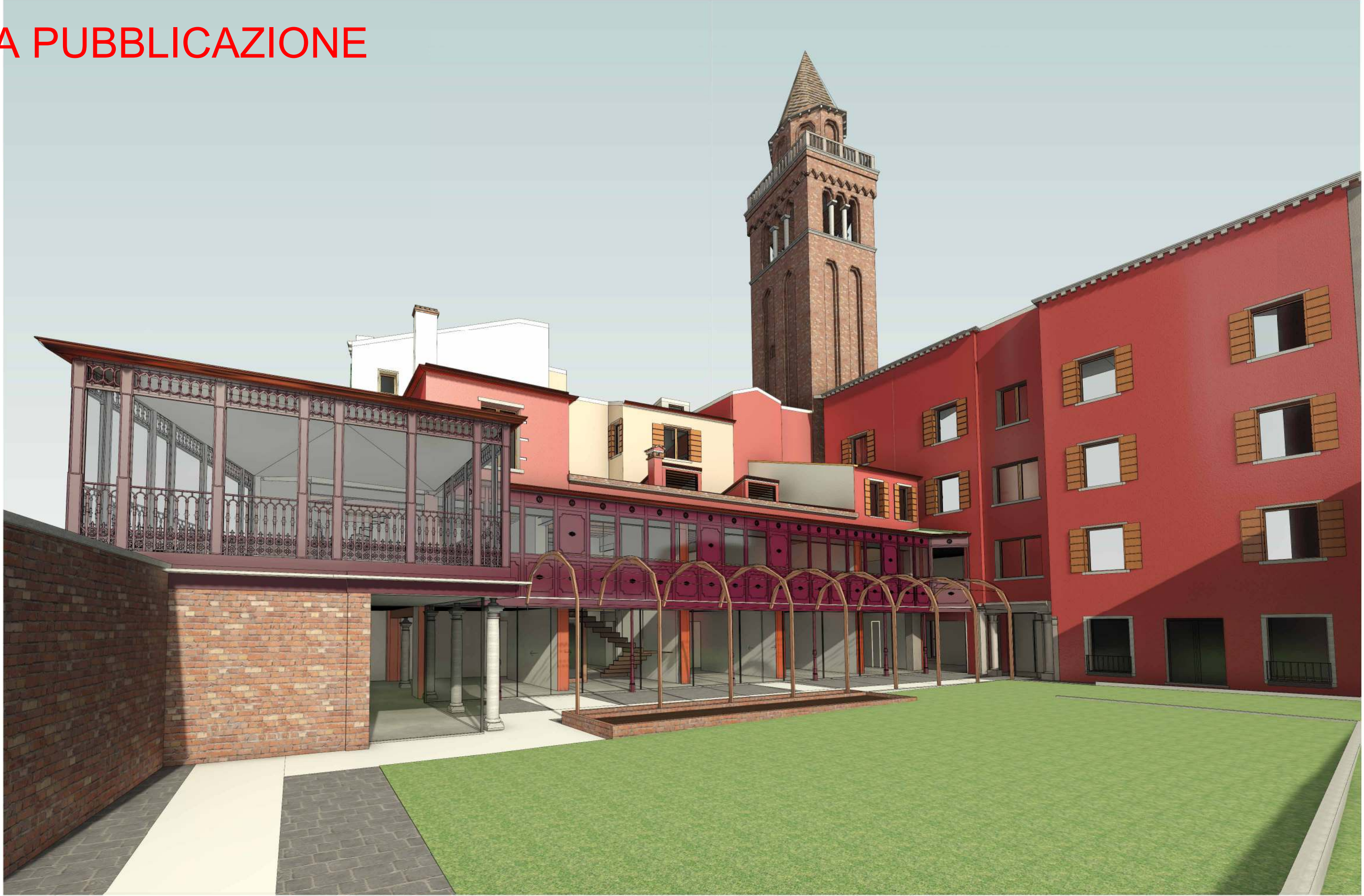
VISTA PROSPETTICA GIARDINO SUD EST Scala | STATO DI PROGETTO