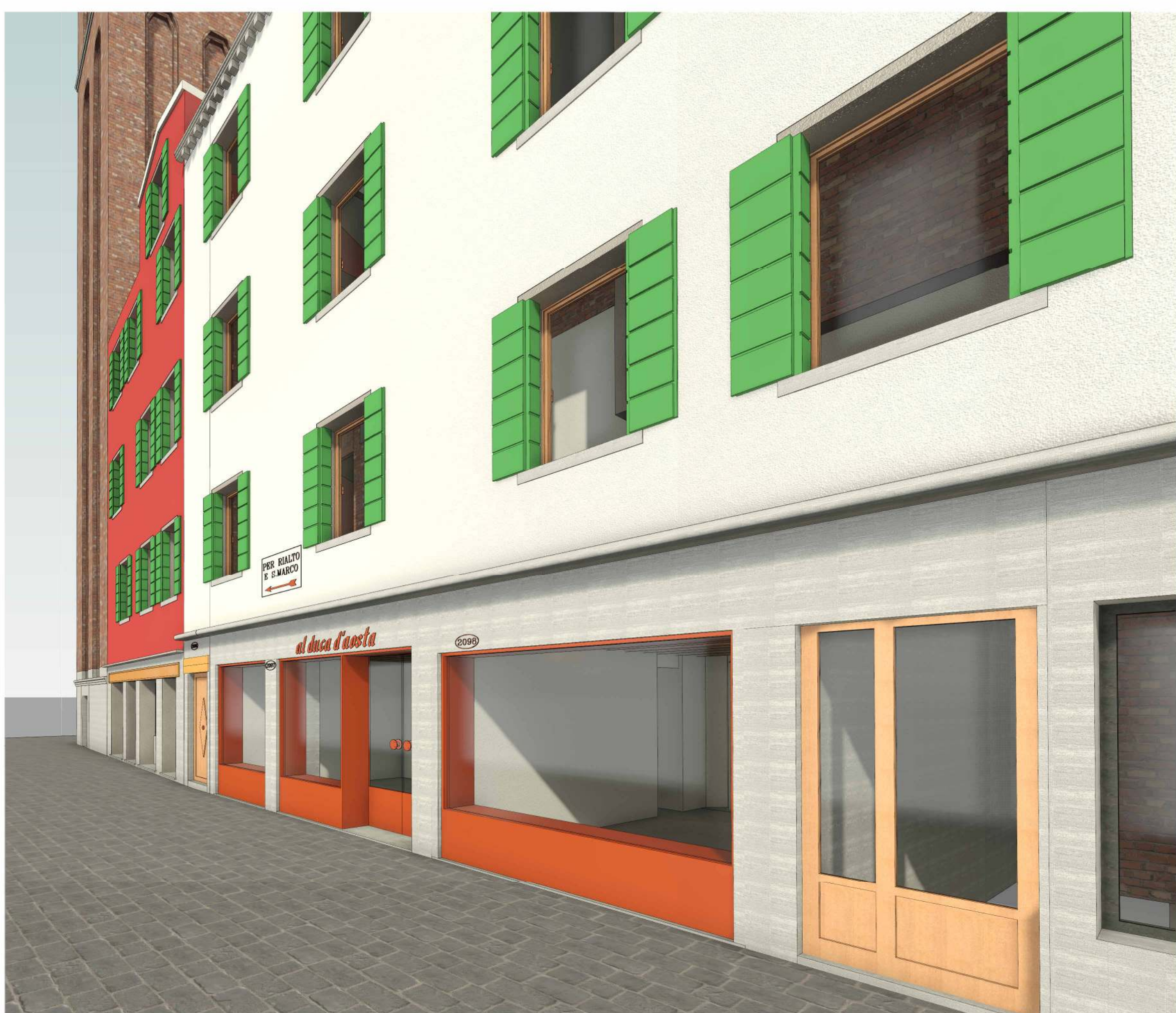
VISTA PROSPETTICA CALLE DEI SAONERI Scala | STATO DI PROGETTO