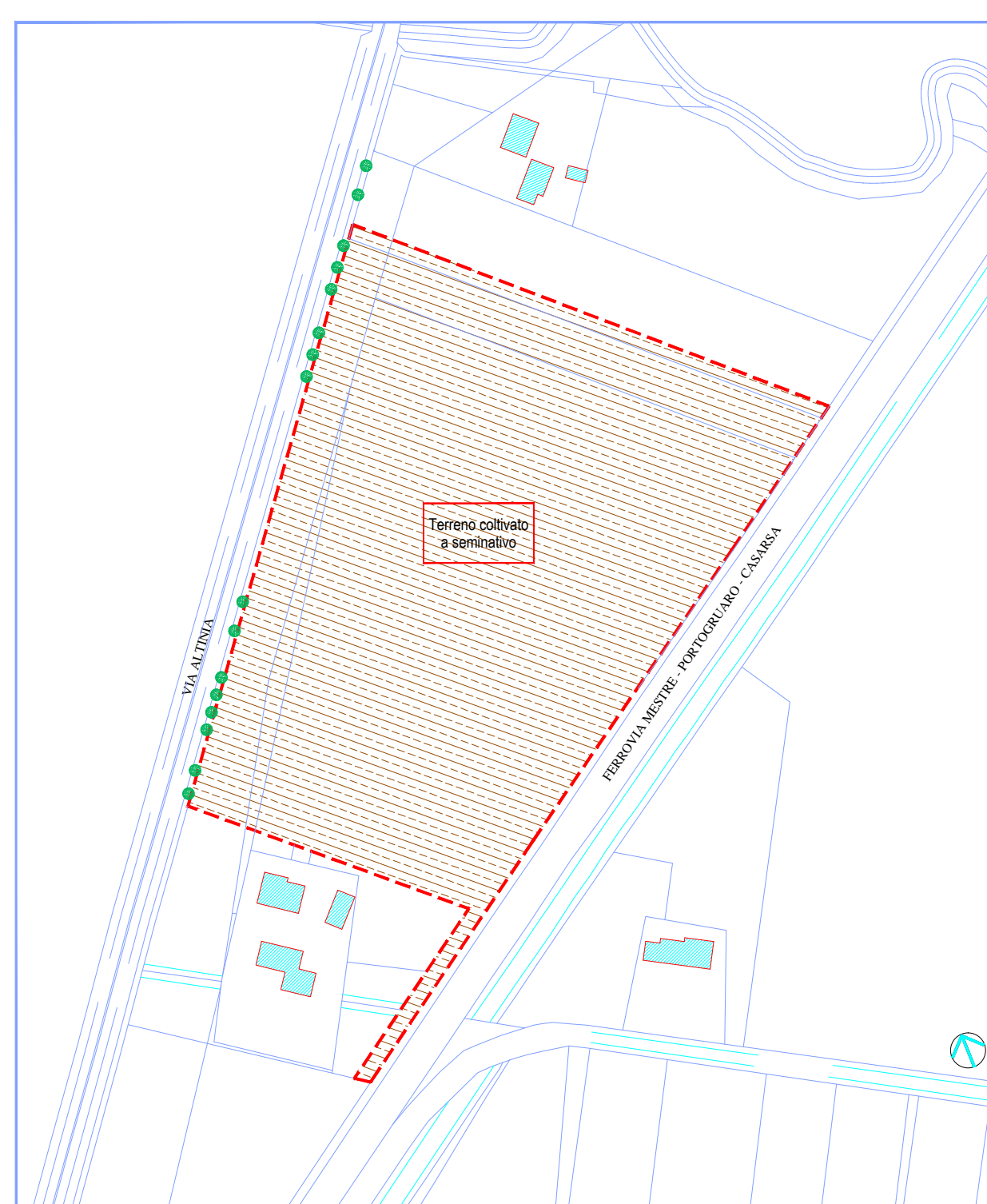
ESSENZE ARBOREE ED USO DEL SUOLO SCALA 1:2000