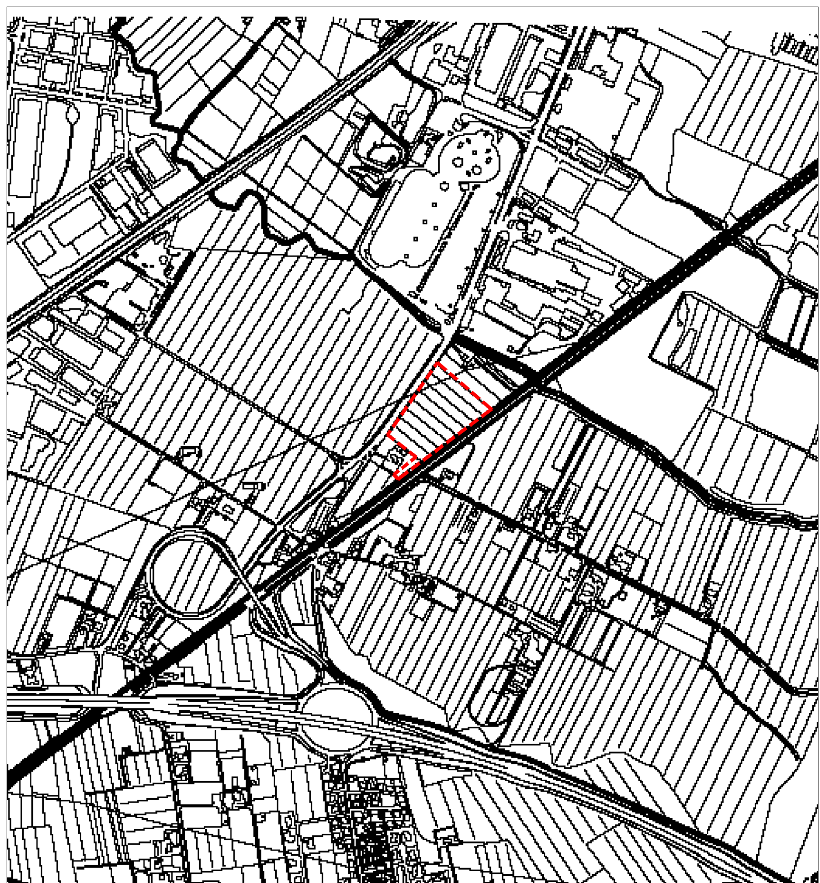
INQUADRAMENTO TERRITORIALE SCALA 1:10.000