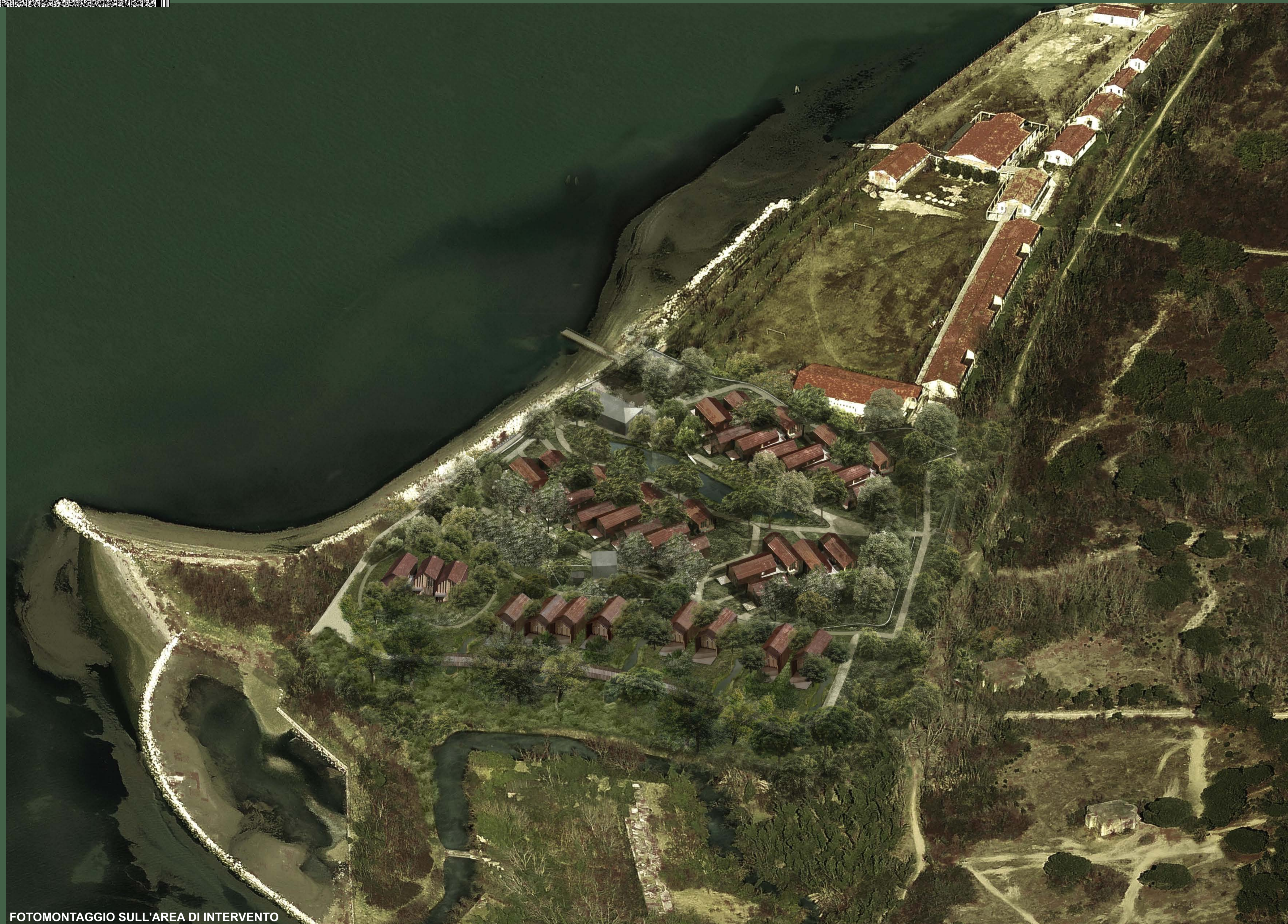
FOTOMONTAGGIO SULL'AREA DI INTERVENTO