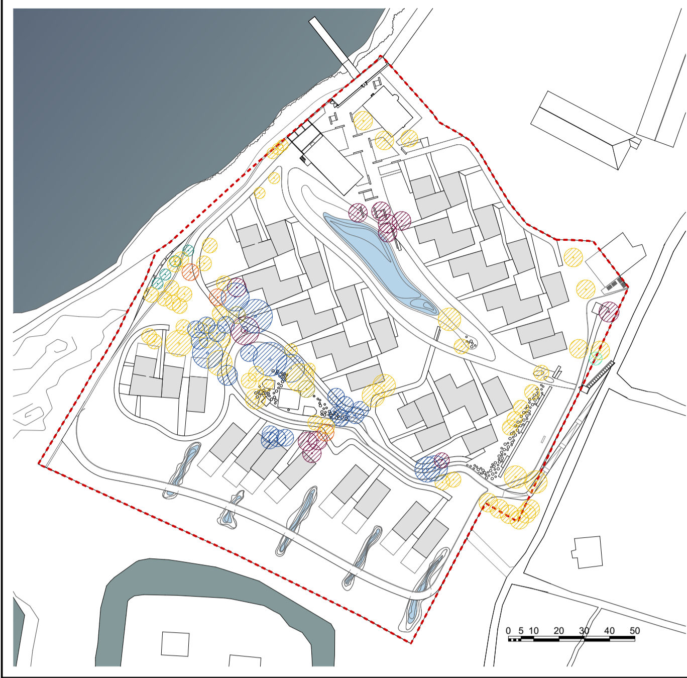
Sovrapposizione rilievo dendrologico e progetto - scala 1:1500