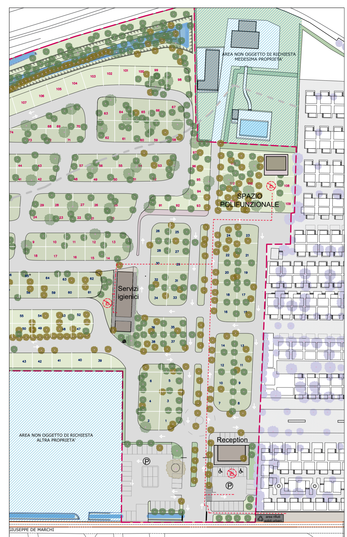
PLANIMETRIA DI INQUADRAMENTO scala 1:1000