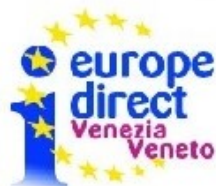
COUNCIL OF EUROPE