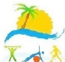
Nordic Walking Alto Vicentino