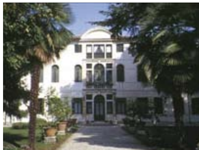
Villa Malvolti Via Trezzo, 56 Carpenedo-Venezia

L'antenna Europe Direct Venezia Veneto è un servizio del Comune di Venezia , inserito in una rete d'informazione ai cittadini per far conoscere le attività e le opportunità offerte dall'Unione Europea. L'obiettivo è di rafforzare nei cittadini il senso di appartenenza all'Unione coinvolgendoli nel processo di costruzione europea.