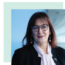
Dubravka Šuica, vicepresidente della Commissione europea responsabile per la Democrazia e la demografia

Il comitato esecutivo riferisce periodicamente alla presidenza congiunta.