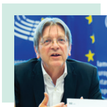
Guy Verhofstadt, membro del Parlamento europeo

La presidenza congiunta è sostenuta da un comitato esecutivo , copresieduto dalle tre istituzioni.