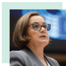
Ana Paula Zacarias, sottosegretaria di Stato per gli Affari europei del Portogallo, per la presidenza di turno del Consiglio dell'Unione europea