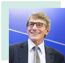
David Sassoli, presidente del Parlamento europeo

La Conferenza è posta sotto l'egida delle tre istituzioni, rappresentate da