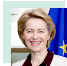
Ursula von der Leyen, presidente della Commissione europea

che svolgono le funzioni di presidenza congiunta .