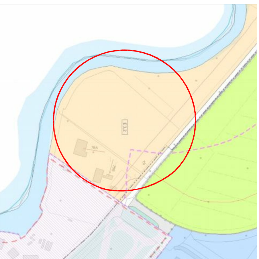
Estratto PRG stato attuale _ scala 1:2000