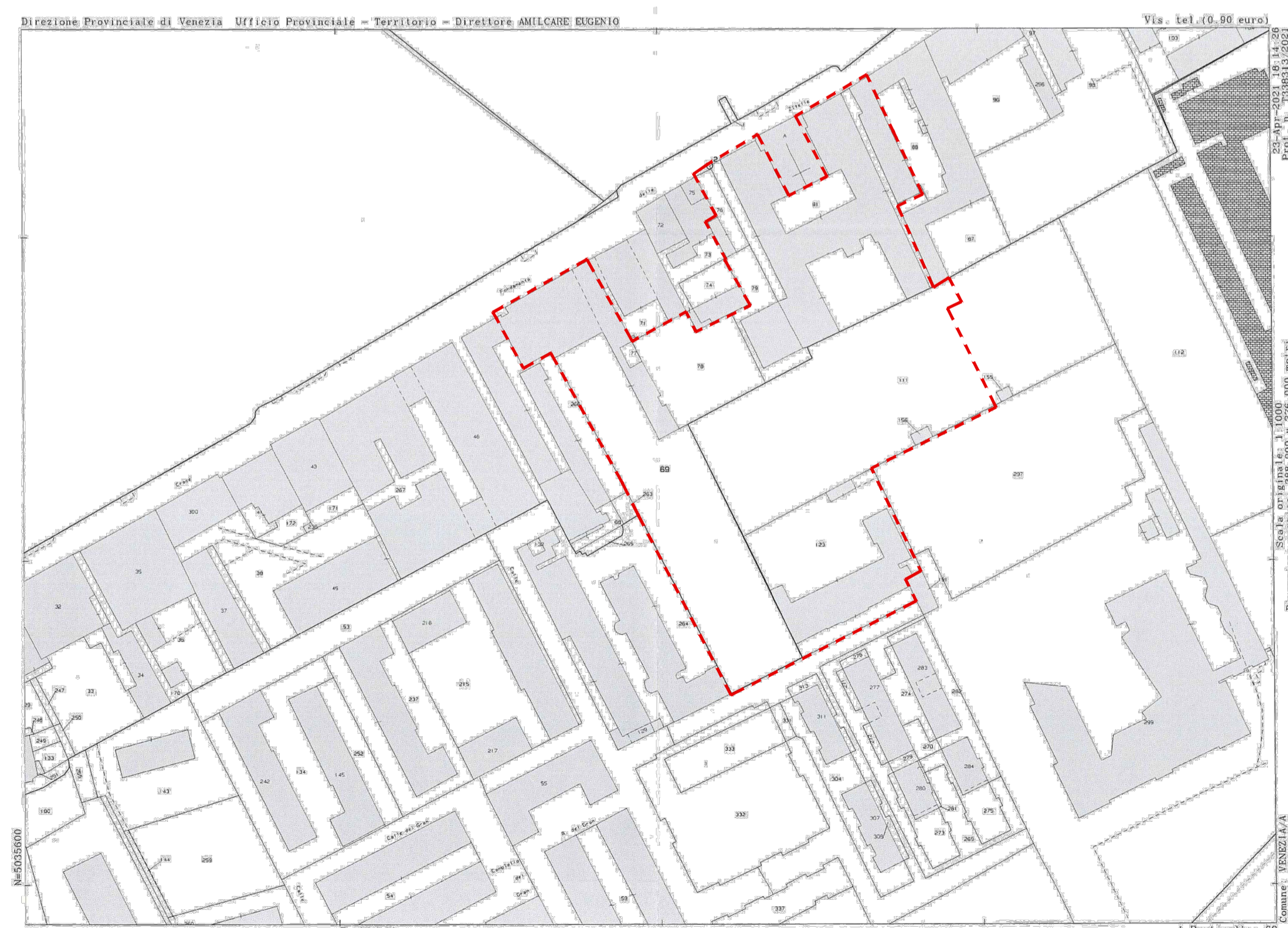
ESTRATTO MAPPA CATASTALE