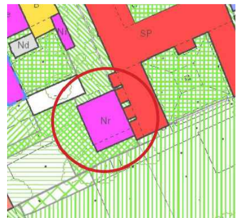
DOMUS Ex Ospizio Sagredo Diedo

Kt "Preottocentesche a capannone senza fronte acqueo"