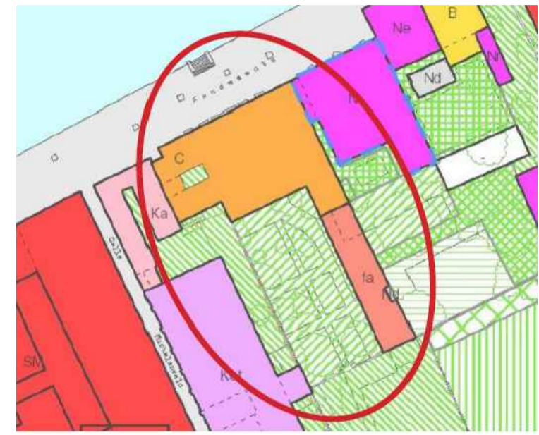
VILLA F Palazzo Volpi Minelli

Nr "Novecentesche integrate nel contesto"