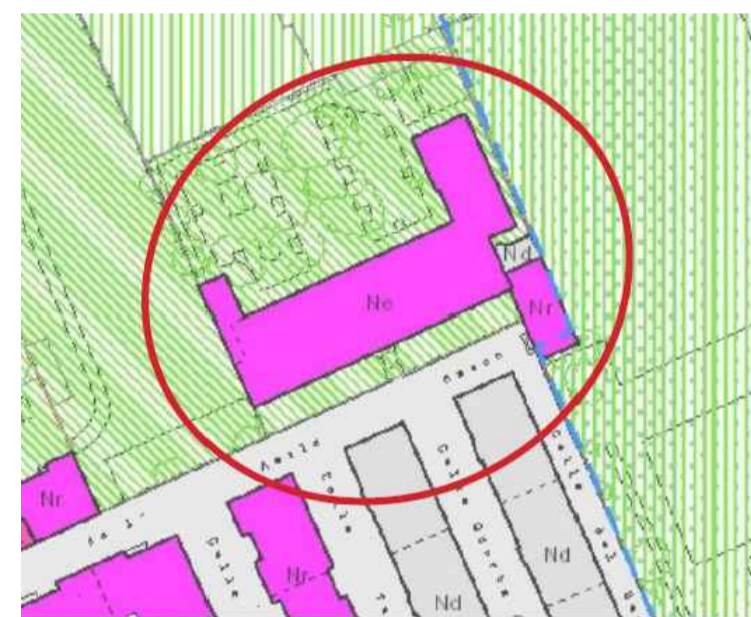
CONVENTINO Ex Asilo MASON

Nr "Novecentesche integrate nel contesto"