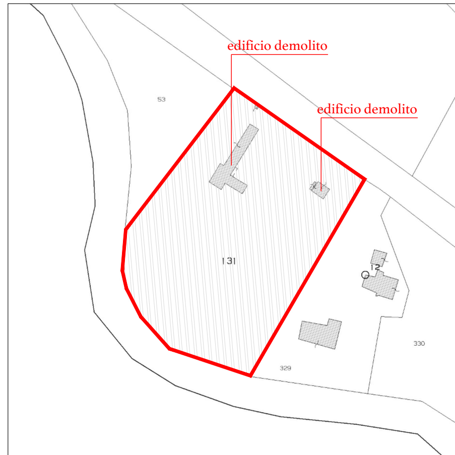
Estratto mappa _ scala 1:2000

PROCEDURA DI SPORTELLO UNICO PER LE ATTIVITÀ PRODUTTIVE DI CUI AL DPR 160/2010 E LEGGE REGIONALE 55/2012 PER LA REALIZZAZIONE DI UN CENTRO NAUTICO CON AREA ACCOGLIENZA, SPAZI OFFICINA E AREE DEPOSITO