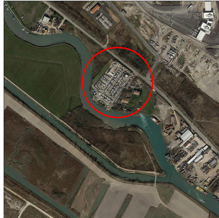
Inquadramento area _ scala 1:5000