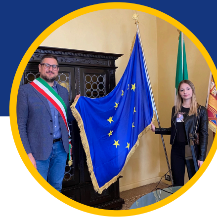
Vicesindaco di Isola della Scala