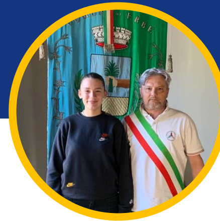
Sindaco di Erbè