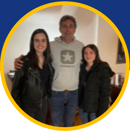
Sindaco di Garda

★ Quali progetti si stanno portando a compimento grazie all'Unione Europea?