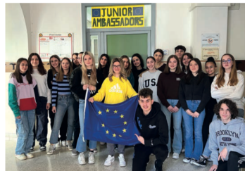
La 3 a C del liceo delle Scienze umane dell'Istituto Seghetti di Verona

Sul tema delle istituzioni europee? Non nella classe 3 a C del liceo delle Scienze umane dell'Istituto Seghetti, che sta partecipando al bando "Scuola ambasciatrice del Parlamento europeo", a cui aderiscono anche le "Leonardo Da Vinci" di Cerea e l'Istituto di istruzione superiore "Marie Curie" di Garda-Bussolengo. L'obiettivo è sensibilizzare gli studenti alla democrazia parlamentare europea e ai valori che hanno portato alla nascita di questa istituzione. Chiamando in causa la generazione nata oltre vent'anni dopo il Trattato di Maastricht, che di Cerea, Euratom e Bce ha sentito parlare solo grazie alla scuola. Entrando nelle aule di piazza Cittadella sembra che la distanza da Bruxelles o Strasburgo, sedi del Par-