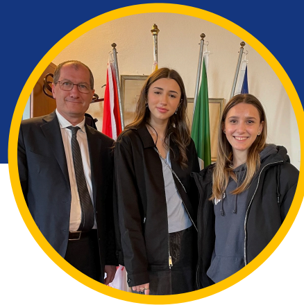
Sindaco di Castel D'Azzano