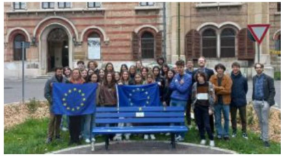
L'inaugurazione La panchina dell'Europa in piazza Arsenale

Vandali ignoti l'avevano imbrattata Rimossa la sbarra anti-bivacco