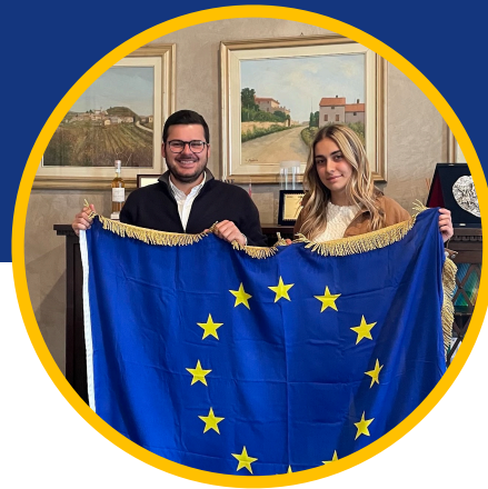
Sindaco di Soave