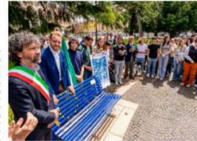
Il blu e le stelle La panchina dipinta come la bandiera dell'Europa MARCHIORI

Realizzata grazie al lavoro della Gioventù federalista Tommasi: «Simbolo in cui crediamo, di pace e diritti»