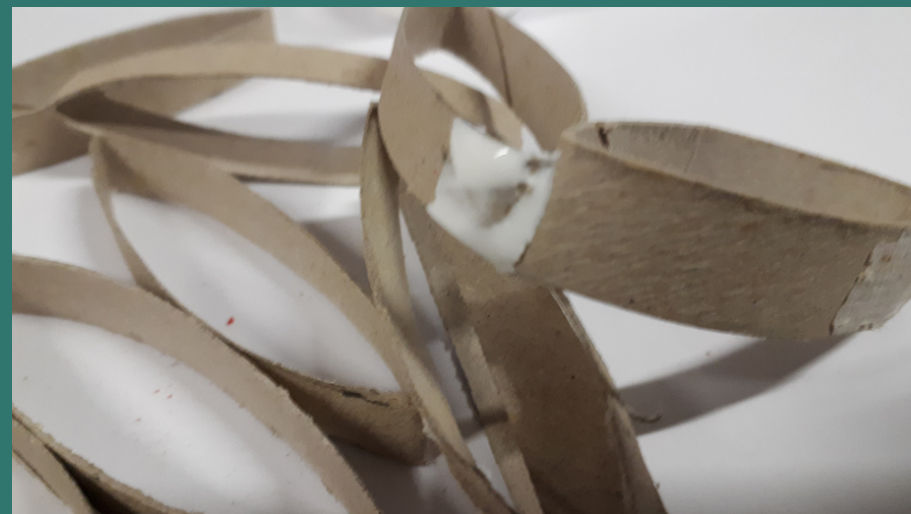
e la incolliamo alla punta di un altro anello