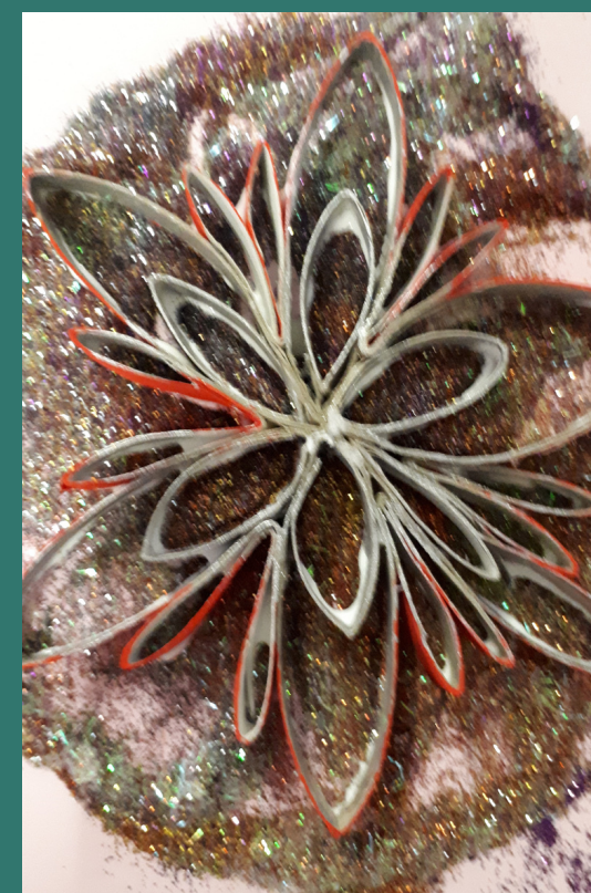
e poi appoggiamo il lato con la colla sopra ai brillantini con una leggera pressione