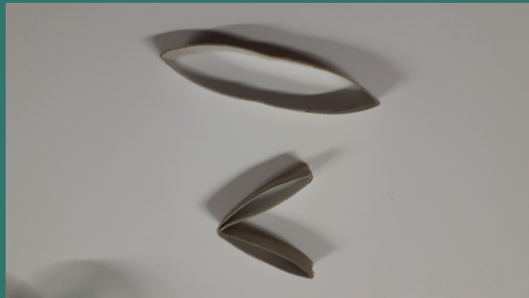
dopo aver piegato a metà l'anello...