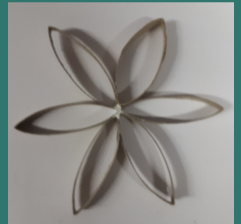
fino a formare una stella