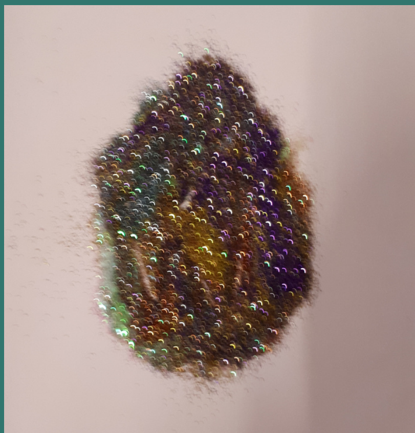
versiamo sopra un foglio i brillantini