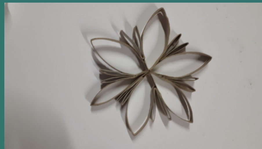
ed ecco il risultato