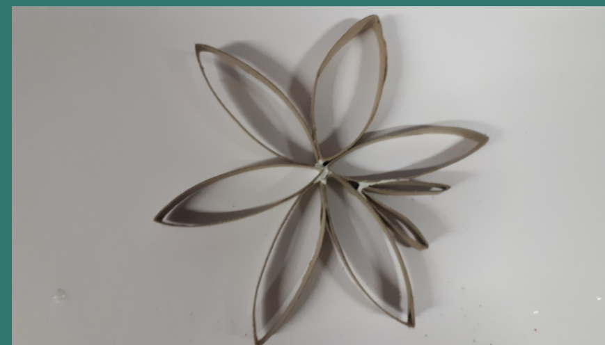
lo incolliamo tra due anelli della stella appena fatta