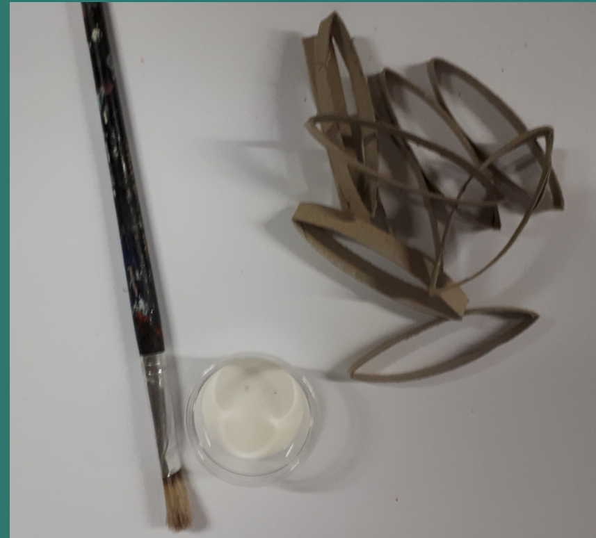
prendiamo ora colla e pennello...