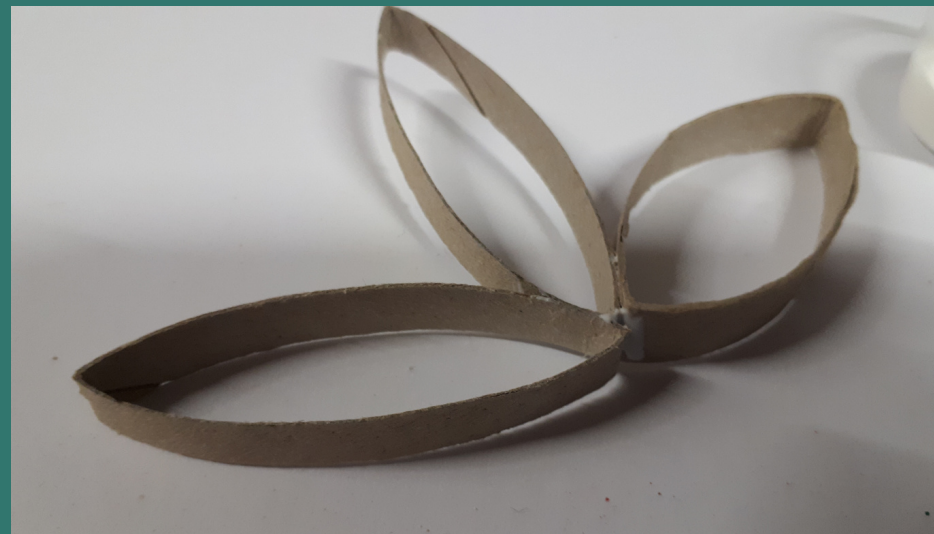
continuiamo ad incollare gli anelli...