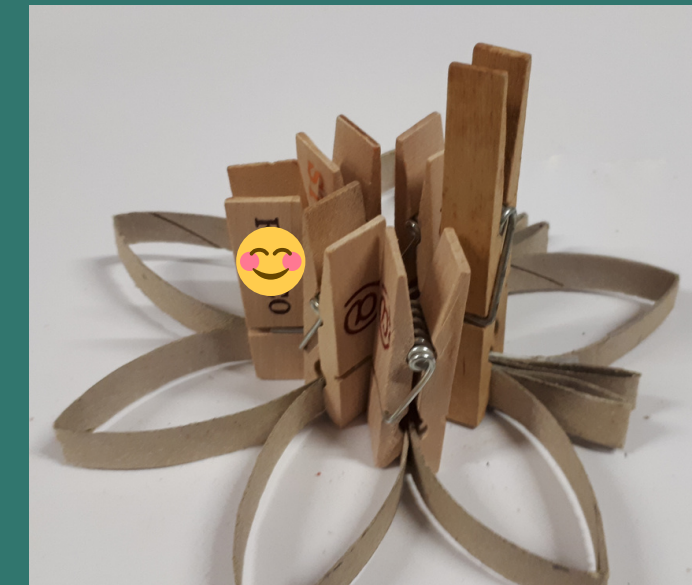
aiutandoci con le mollette