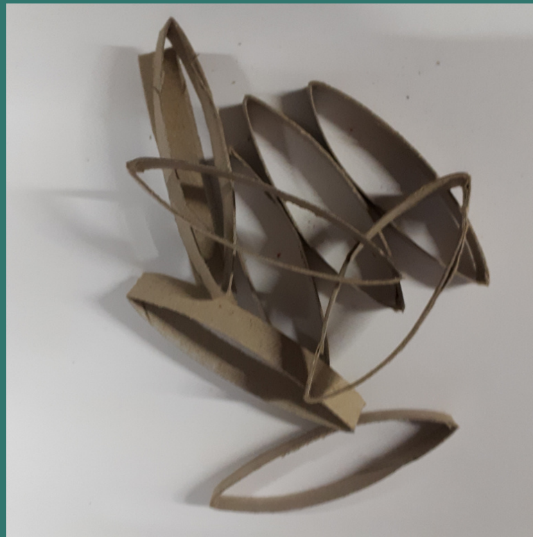
avremo così tanti anelli piatti