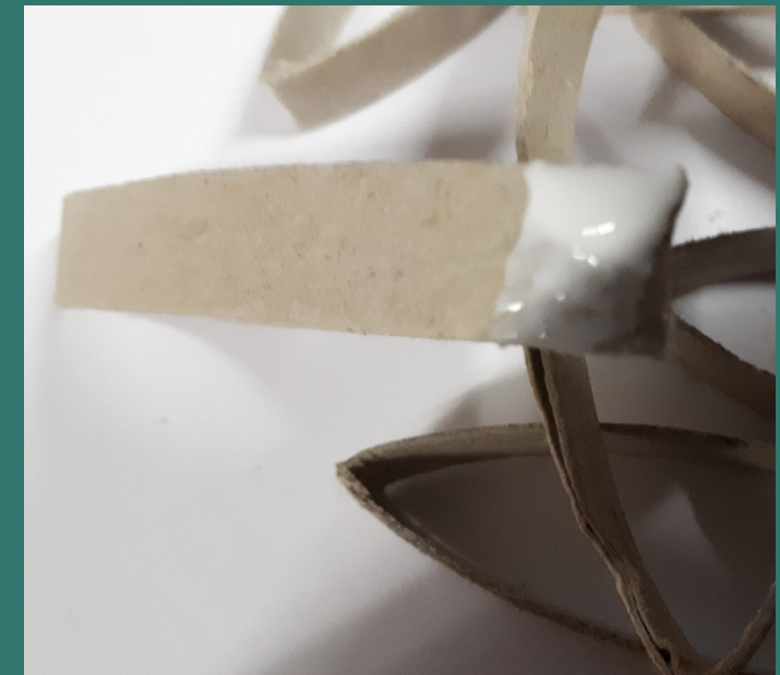
spalmiamo la colla su una punta dell'anello