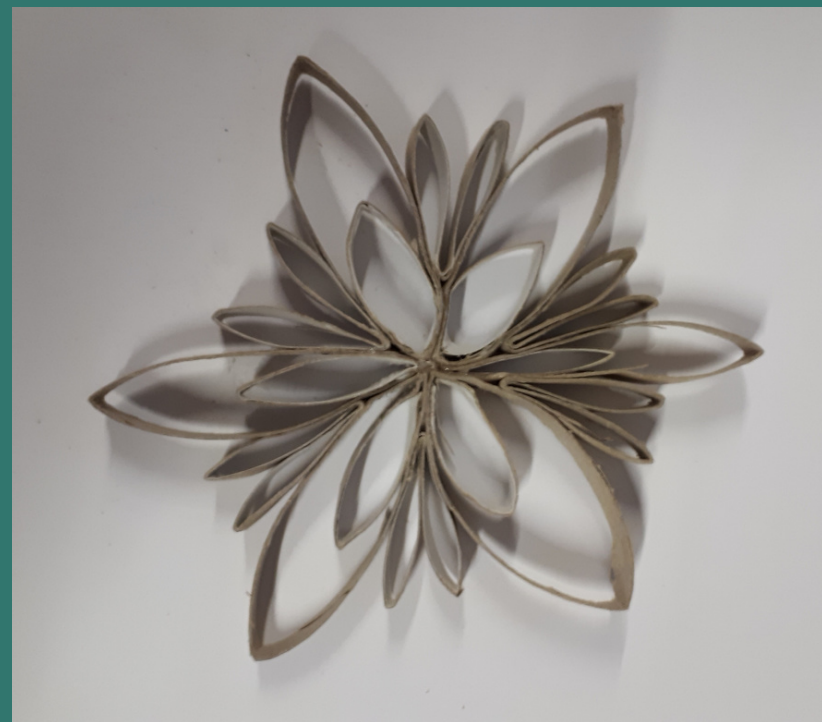
fino ad avere questo risultato