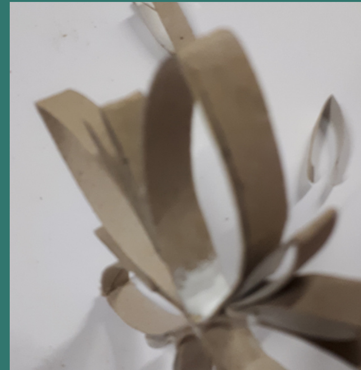
e lo incolliamo all'interno delle asole grandi