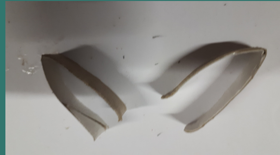
lo tagliamo a metà