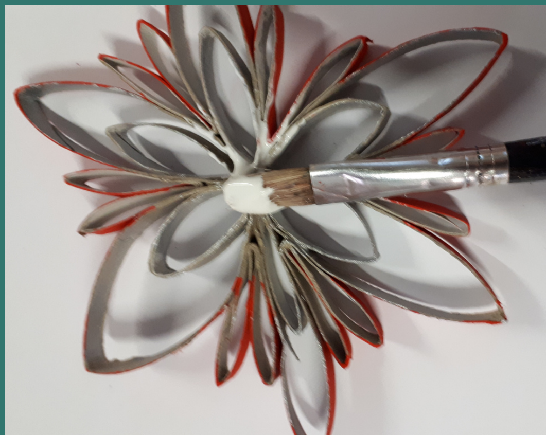
spalmiamo la colla su un lato della stella