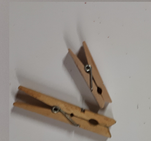
qualche piccola molletta