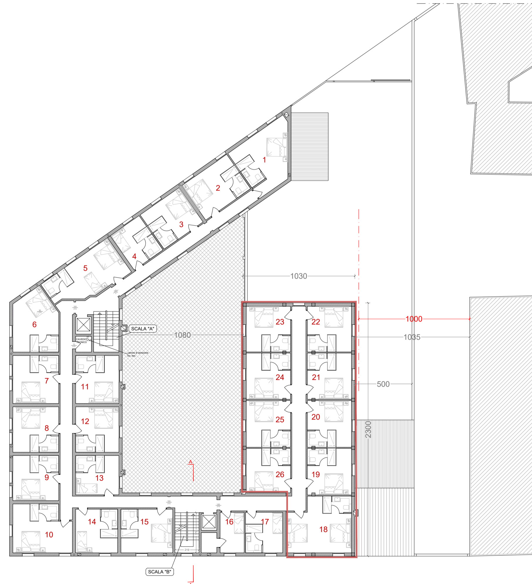
PIANTA PIANO SECONDO