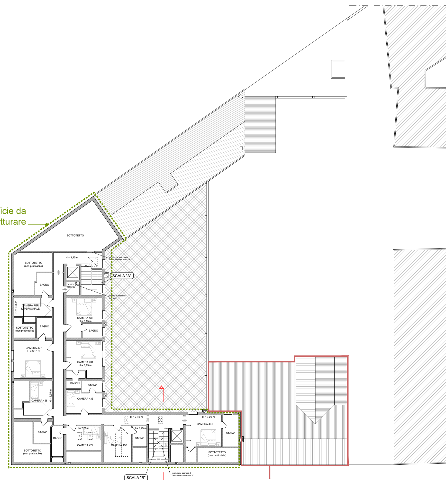
PIANTA PIANO QUARTO

ZONA RICOMPOSIZIONE P.T. E AMPLIAMENTO PIANI SUPERIORI