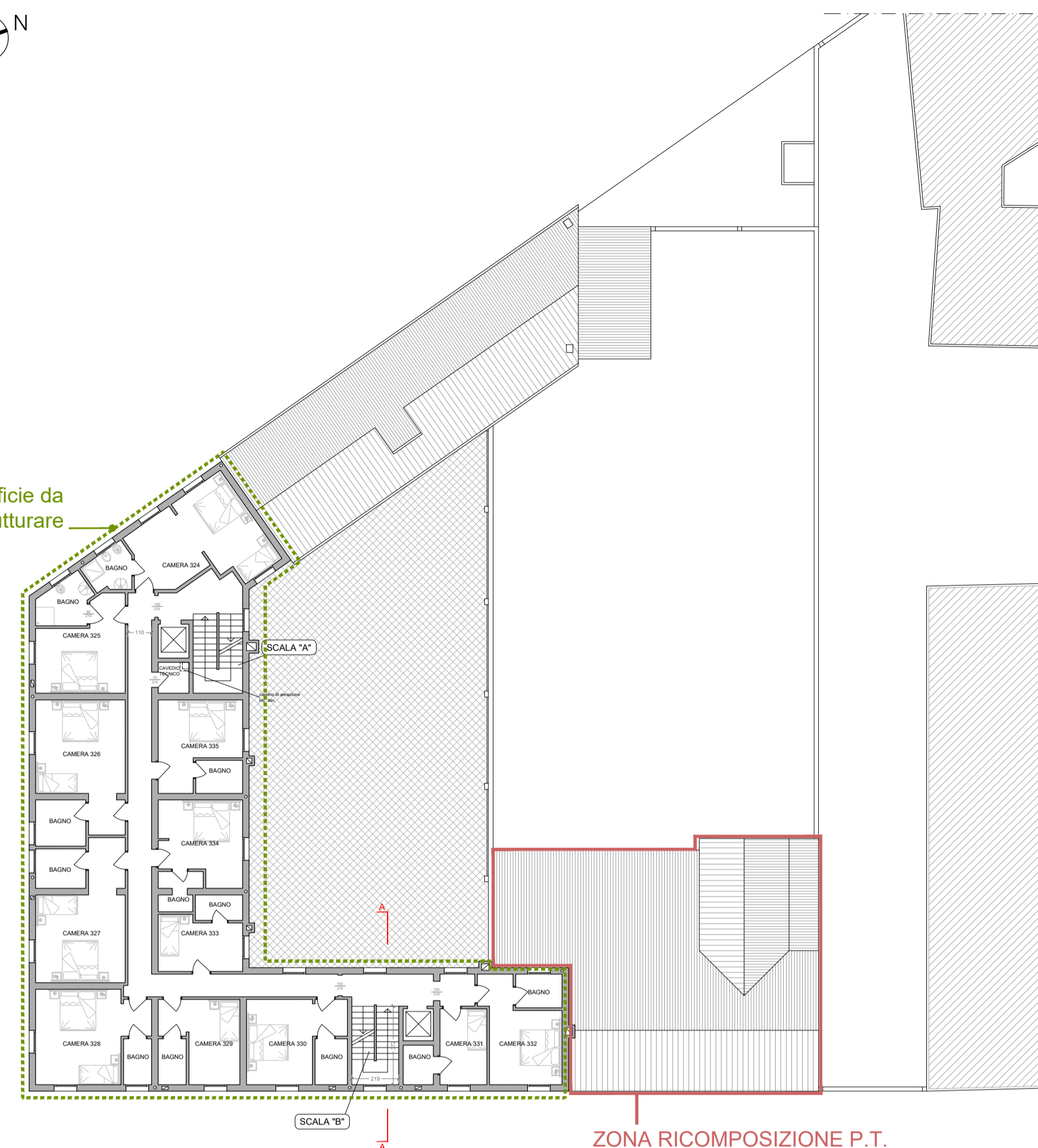
PIANTA PIANO TERZO

ZONA RICOMPOSIZIONE P.T. E AMPLIAMENTO PIANI SUPERIORI