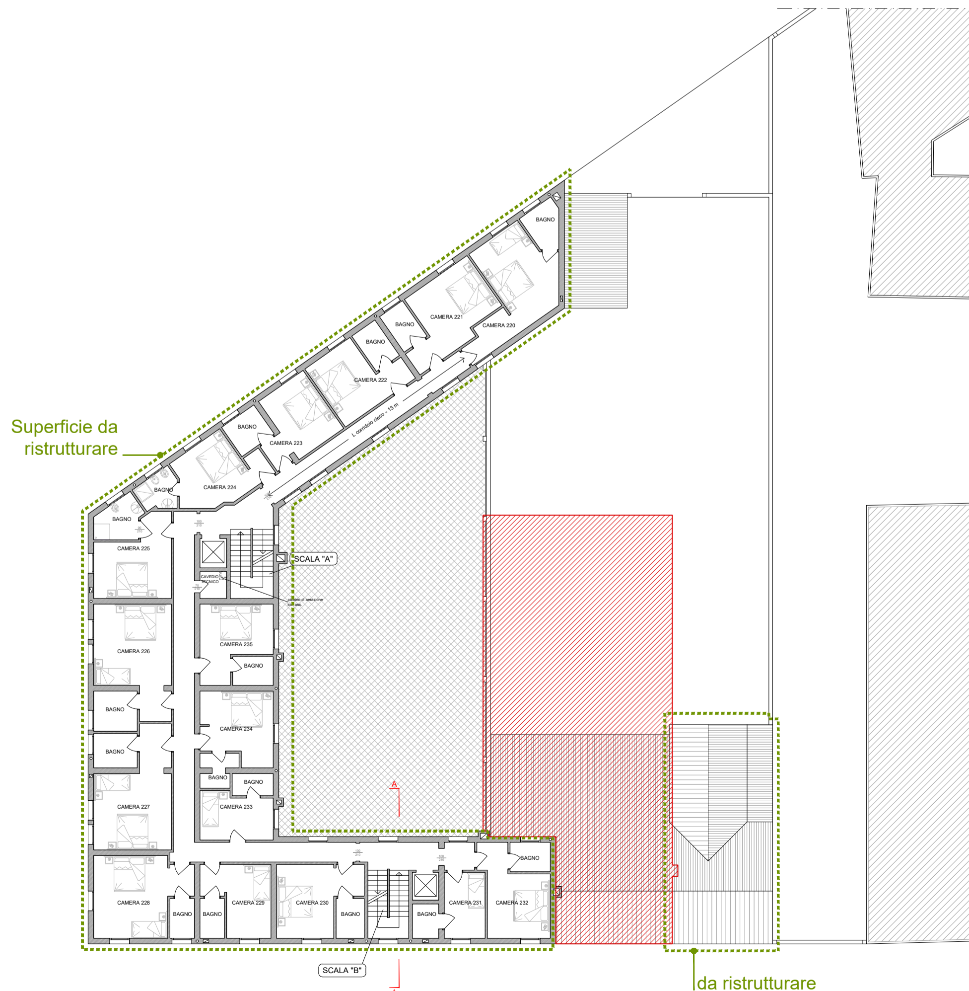
PIANTA PIANO SECONDO