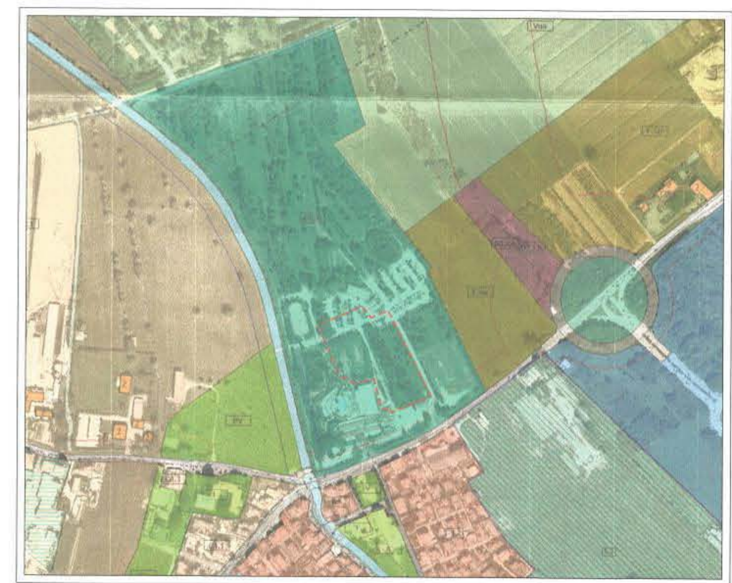
ESTRATTO DI PRG scala 1:5000 Z.T.O. D ed attività produttive isolate in sede impropria Sottozona D8.a Attività florovivaistica