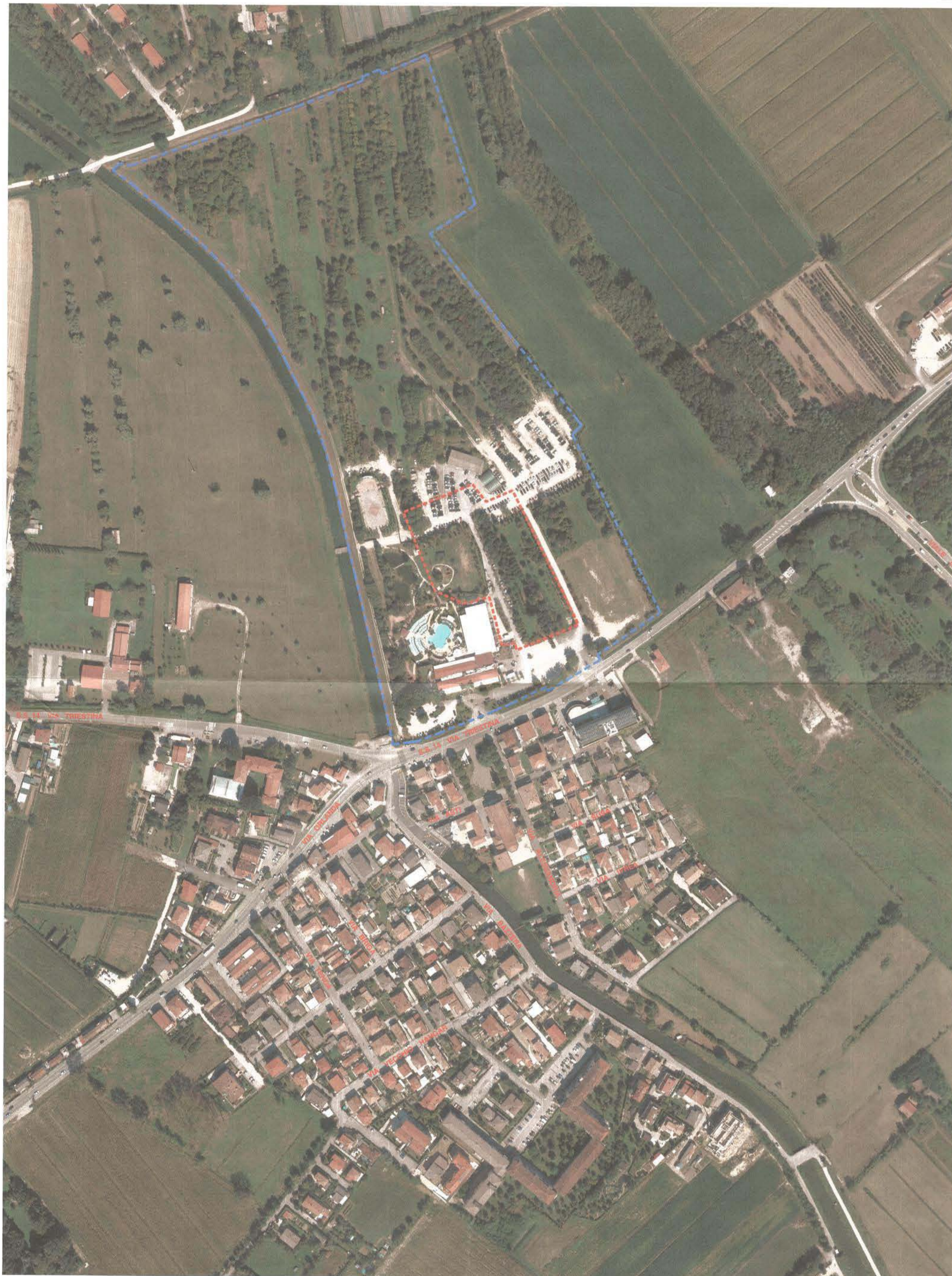
ORTOPIANO CON TOPONOMASTICA SCALA 1:2000

--- Limite Area delle Proprietà --- Perimetro Area di Intervento (mapp.li 388-421-423-425-428-430-432-433-435-436)