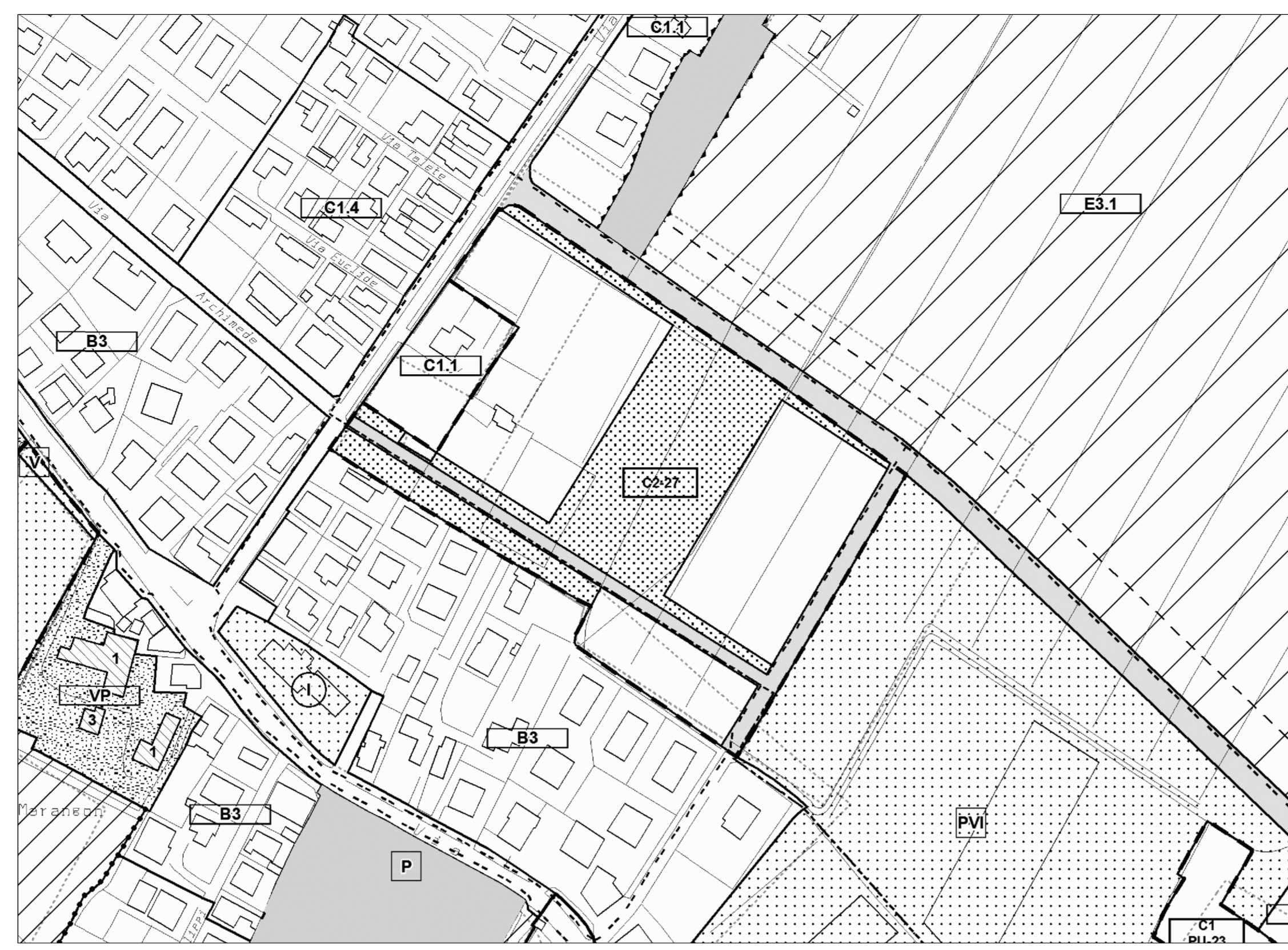
ESTRATTO DA P.R.G. VIGENTE (approvato con Delib. G.R.V. 3905/04 e 2141/08)

Adozione con delibera G.C. n. 231 del 27.05.2015 Esecutiva il 29.06.2015 Approvazione con delibera G.C. n. del Esecutiva il