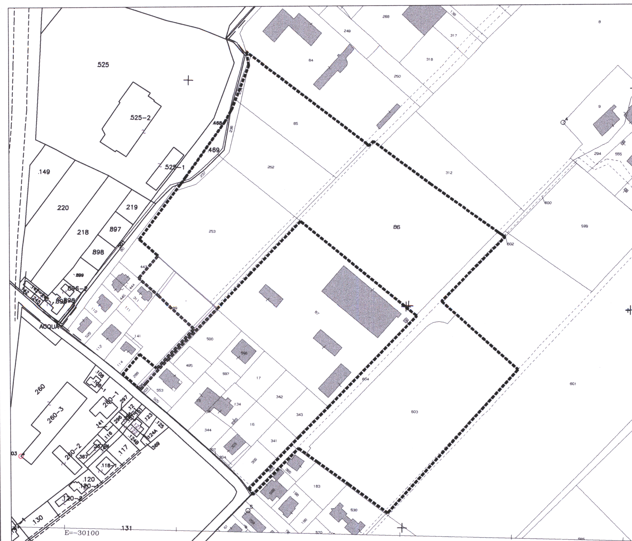
ESTRATTO MAPPA CATASTALE (fig.16-21 sez. Mestre)