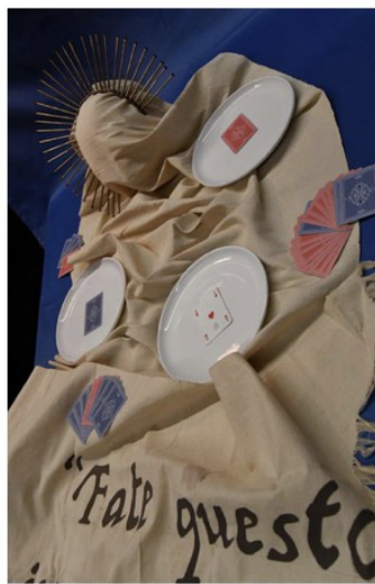
9 - Camilla Delsignore e Susanna Testa