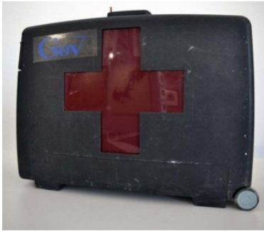
3 - Franko B