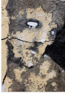
1 - Marco Abrate