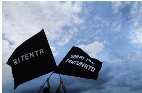
7 - Stefano W. Pasquini