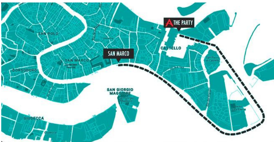
Figura 1 Figura 1