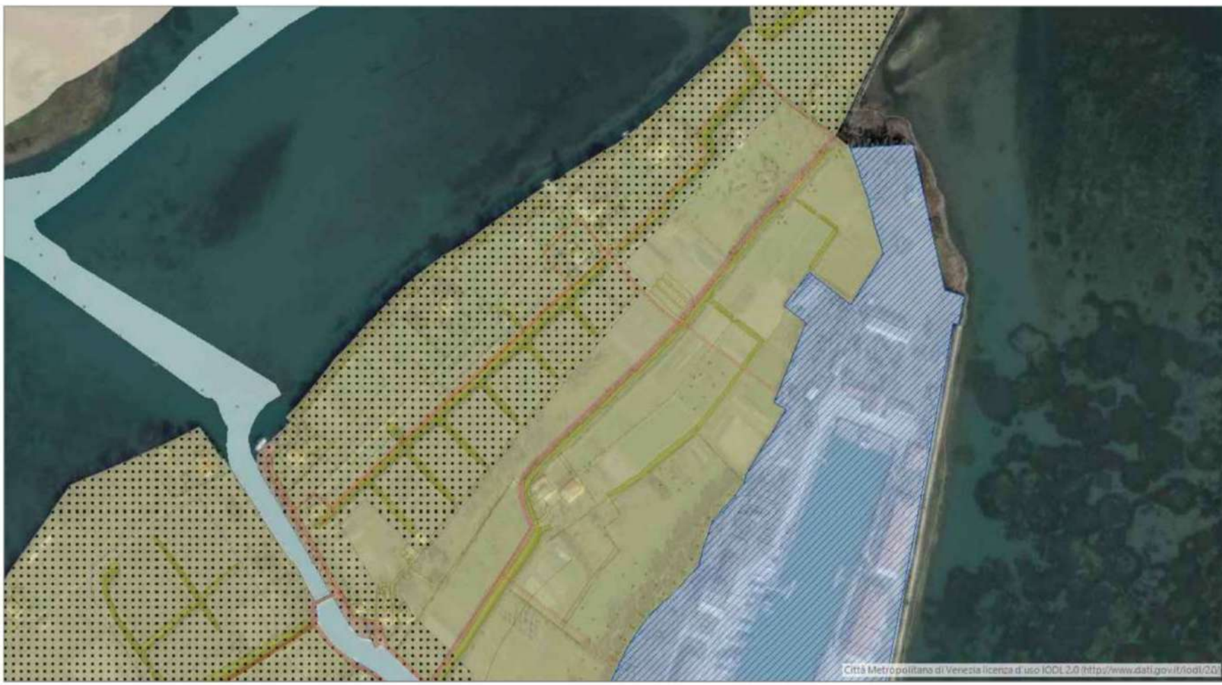
Estratto P.R.G.C. 1:5000