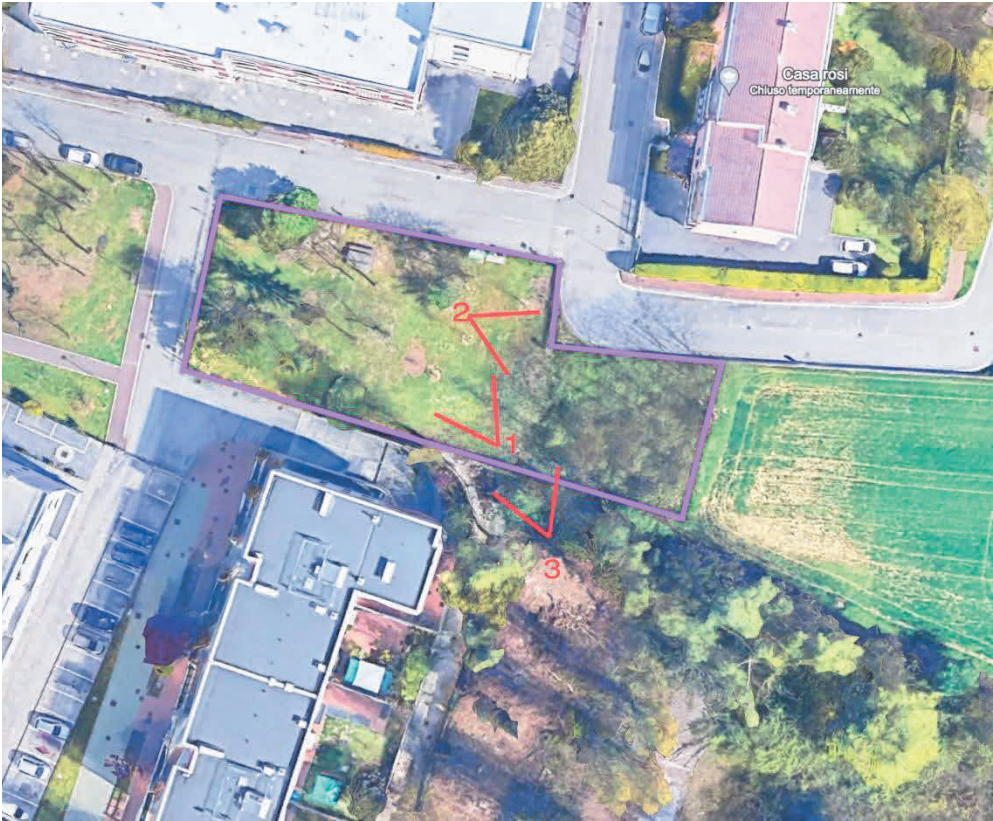
1 - Vista verso est dell'area verde di Via Buozzi