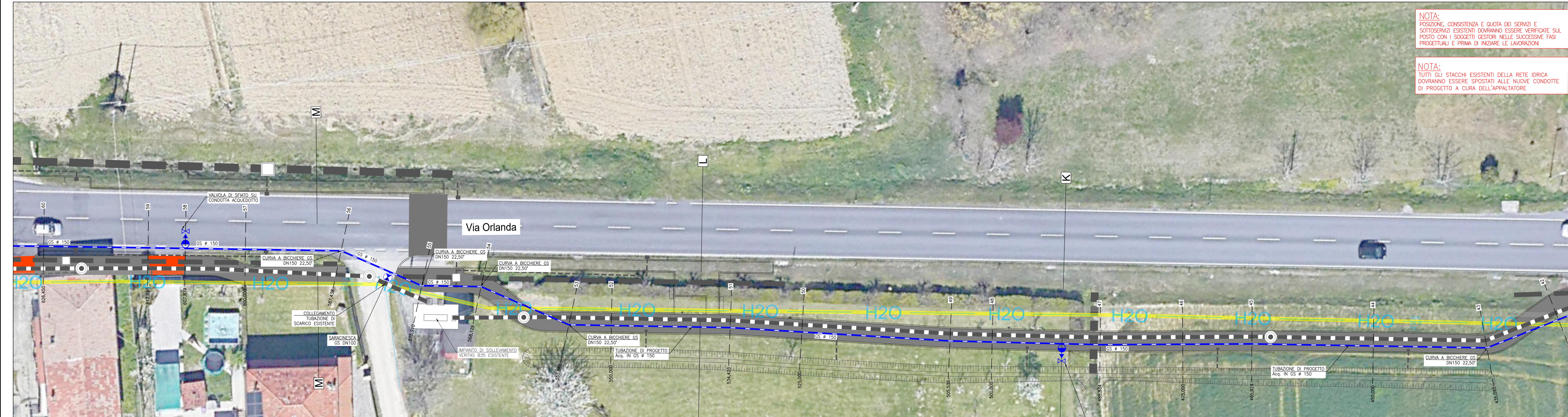
PLANIMETRIA DI PROGETTO SU ORTOFOTO - FINESTRA 8

NOTA: POSIZIONE, CONSISTENZA E QUOTA DEI SERVIZI E SOTTOSERVIZI ESISTENTI DOVRANNO ESSERE VERIFICATE SUL POSTO CON I SOGGETTI GESTORI NELLE SUCCESSIVE FASI PROGETTUALI E PRIMA DI INIZIARE LE LAVORAZIONI NOTA: TUTTI GLI STACCHI ESISTENTI DELLA RETE IDRICA DOVRANNO ESSERE SPOSTATI ALLE NUOVE CONDOTTE DI PROGETTO A CURA DELL'APPALTATORE