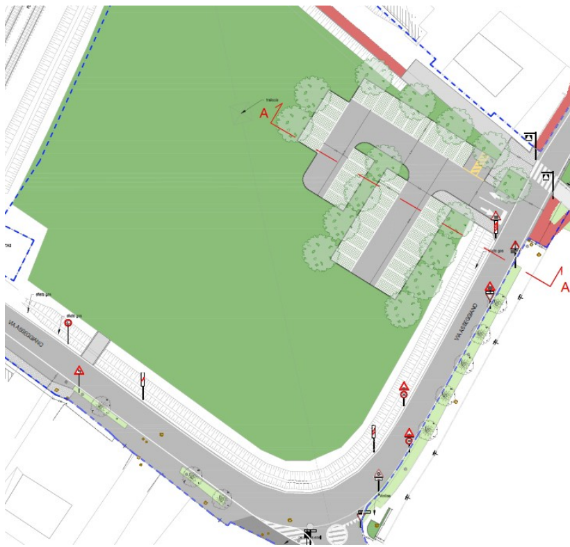
Figura 1: Estratto della planimetria del progetto definitivo approvato nell'ambito dell'intervento denominato C.i: 14585 "Realizzazione pista ciclopedonale di via Asseggiano"

Il parcheggio pertinenziale al centro abitato del quartiere Gazzera sarà ricavato invece dalla modifica di una porzione del parcheggio esistente attualmente riservato all'Istituto Scolastico "U. Morin" e ricompreso nell'area scolastica, al fine di rendere tale parcheggio al servizio del quartiere.