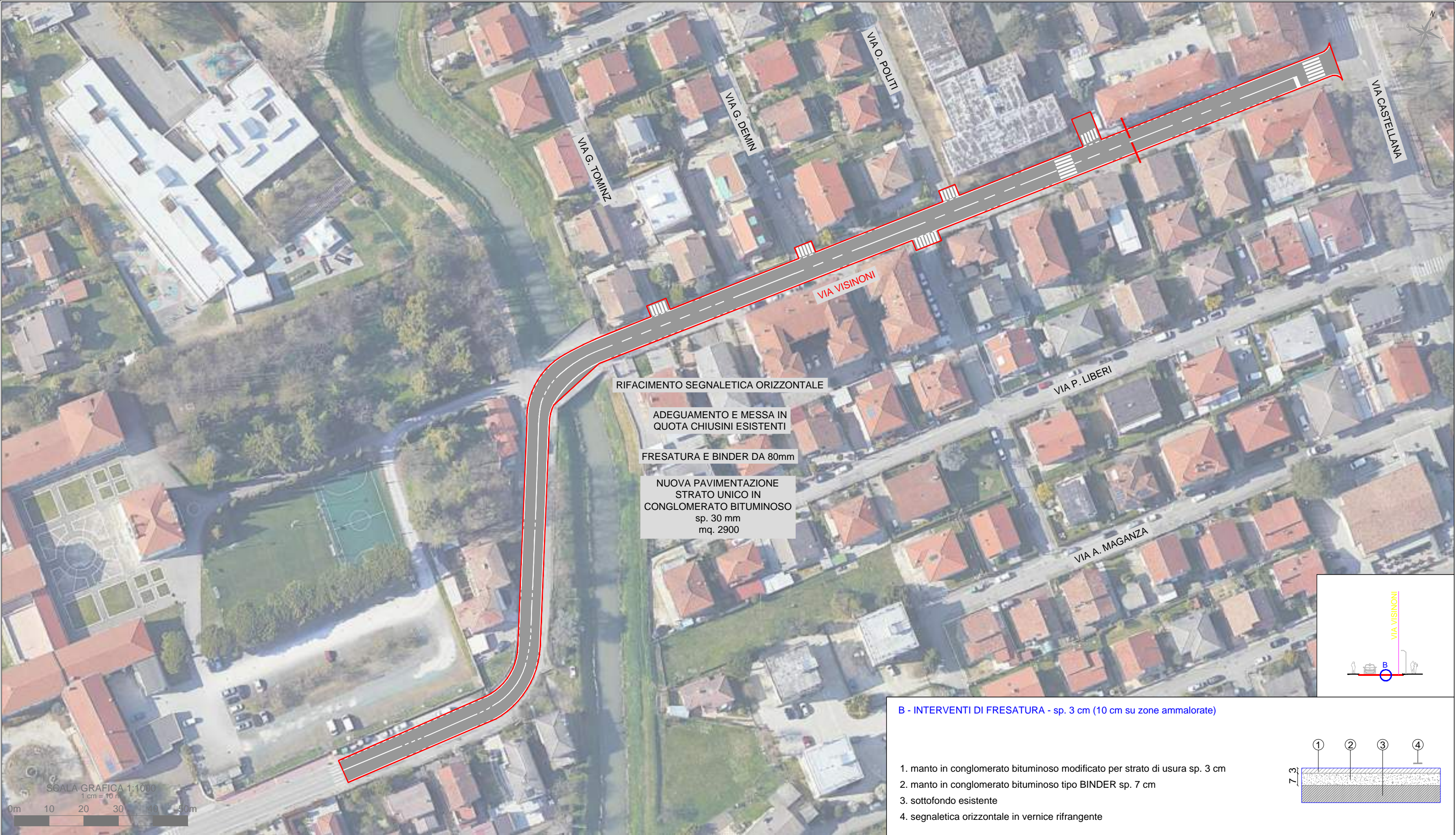
B - INTERVENTI DI FRESATURA - sp. 3 cm (10 cm su zone ammalorate)