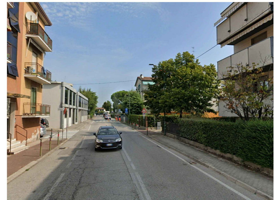
2. VIA PASQUALIGO: asfaltatura sede stradale - stato di fatto