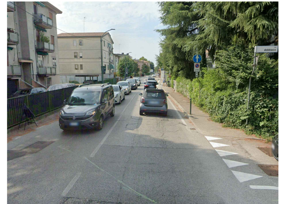
1. VIA PASQUALIGO: asfaltatura sede stradale - stato di fatto