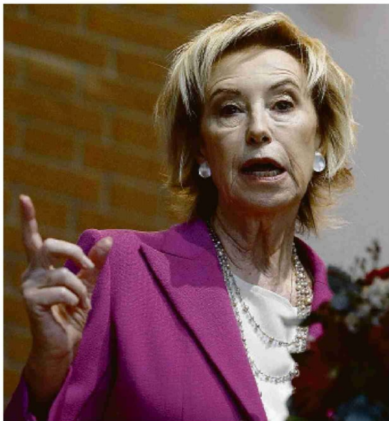
INDIZI INCROCIATI In alto, Letizia Moratti. A destra, Romano Prodi Sotto, l'ex segretario del Pds Achille Occhetto

Con l'avvicinarsi delle Europee qualcosa si muove: votare non è inutile