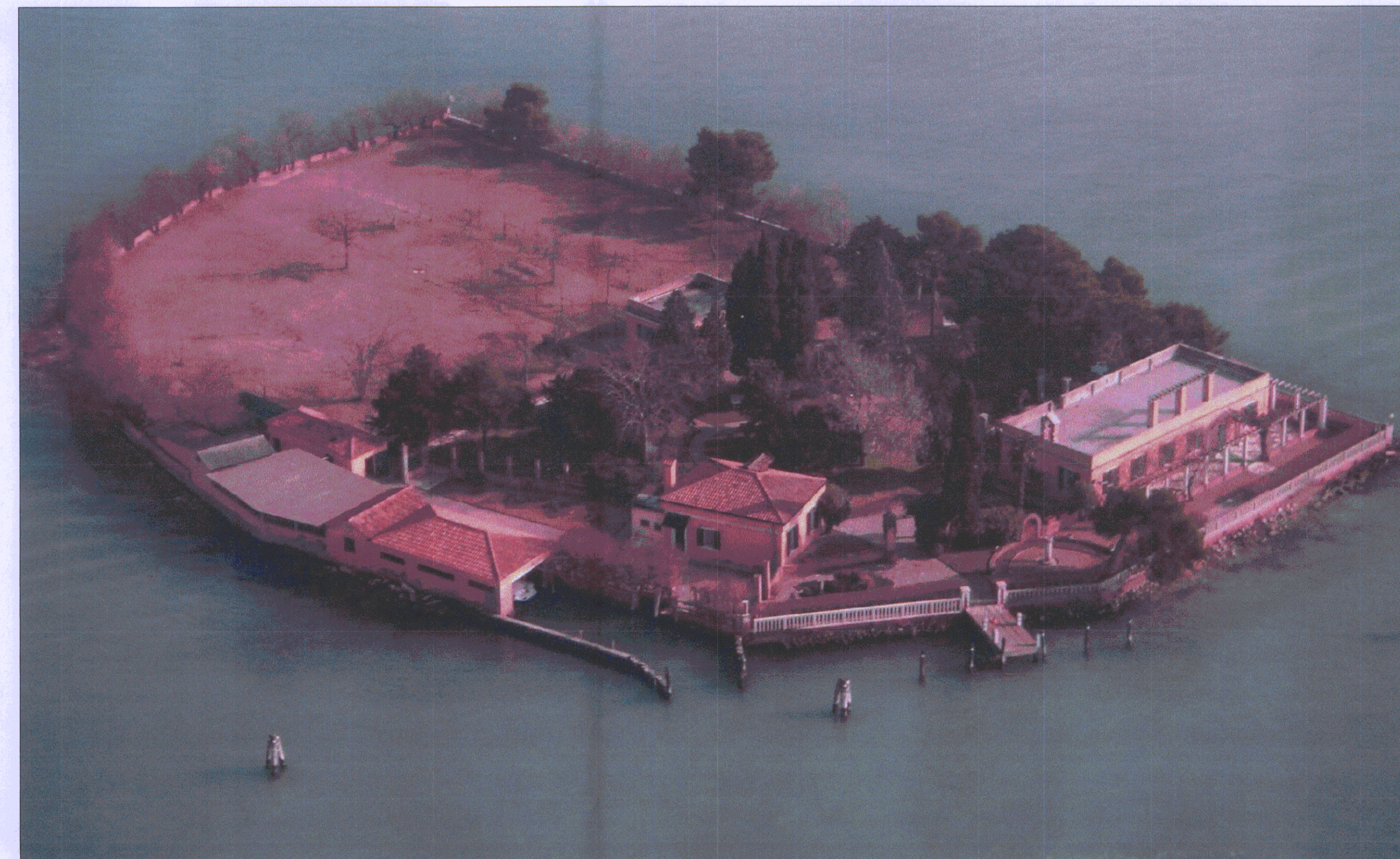
4.visione da ovest