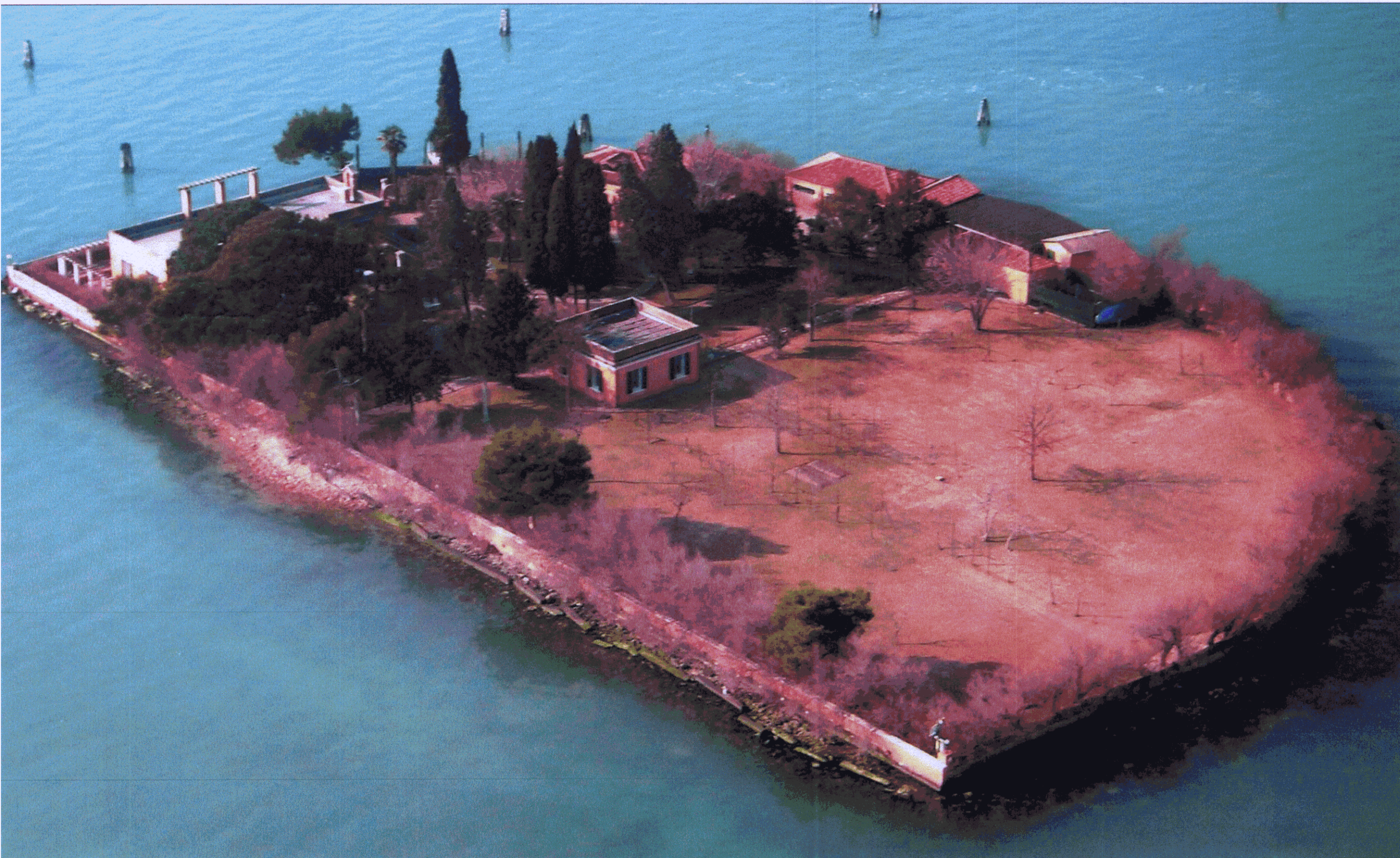
1.visione da est

marino folin/ san polo 1898a 30125 venezia/ marino.folin@mac.com/ 386 albo appc-sa venezia/ FLNMRN44A29L736E/ pi 03688540271